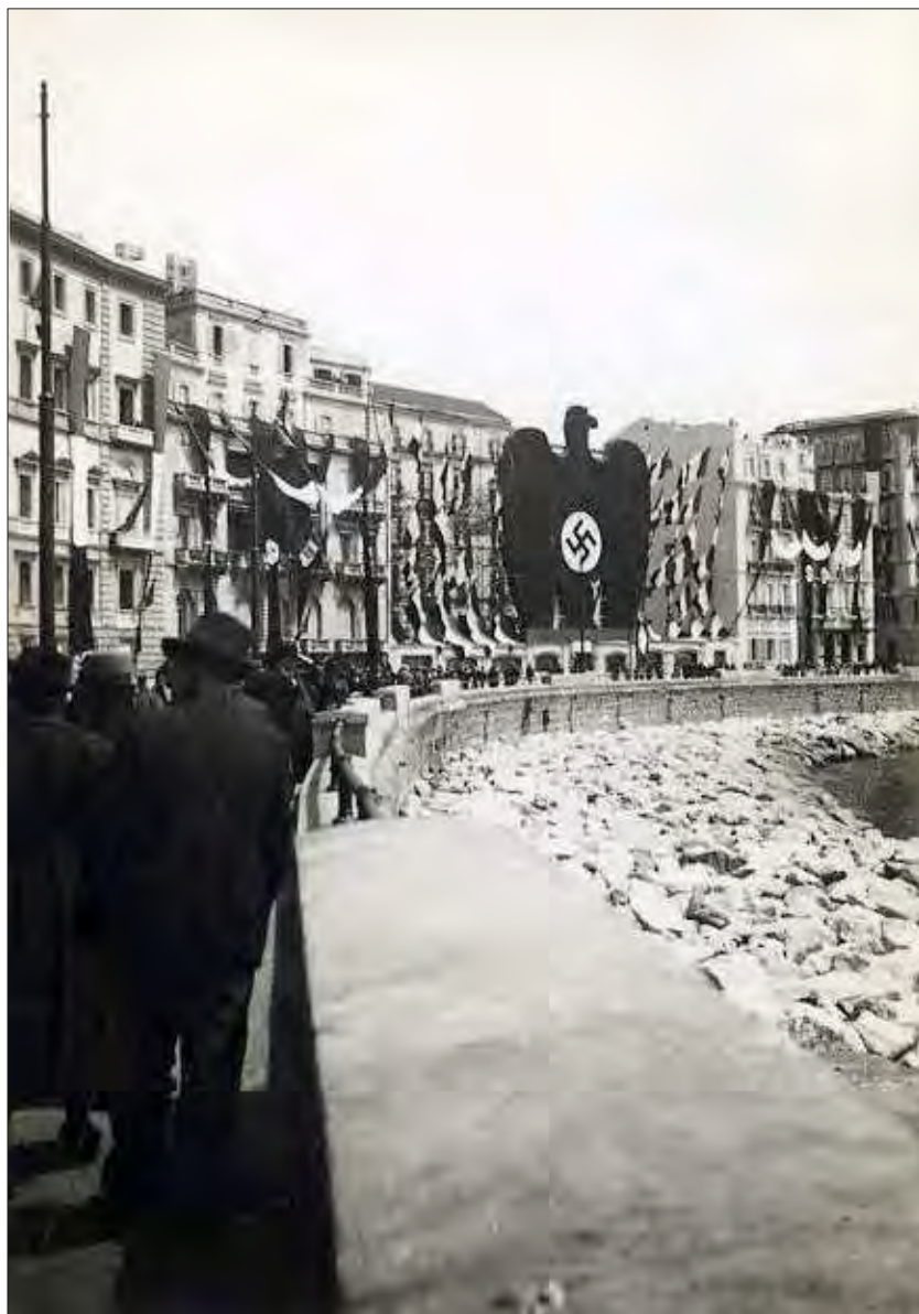
Fig. 5 - Napoli, 5 maggio 1938, via Partenope: visita di Adolf Hitler a Napoli. A sinistra Palazzo Du Mesnil, attuale sede dell'Orientale.