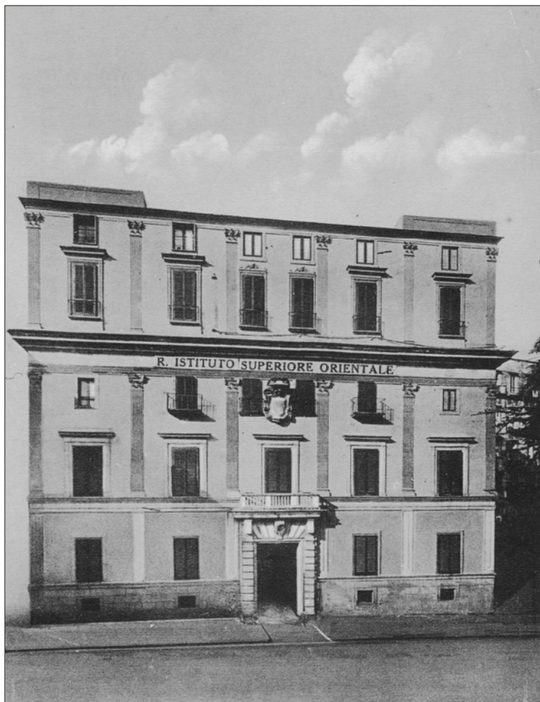
Fig. 2 – Palazzo Giusso, sede dell'Istituto Orientale nel 1934 (ASOr, fototeca).