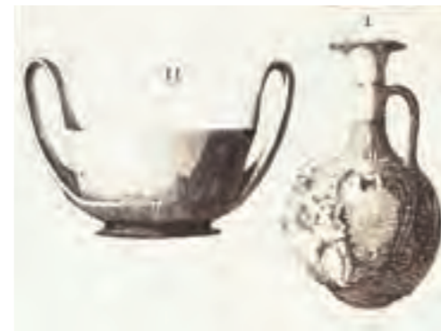
Fig. 3 Kantharos in bucchero campano (da Caylus 1752-1767, vol. 1 [1752], tav. XXXIII, II)