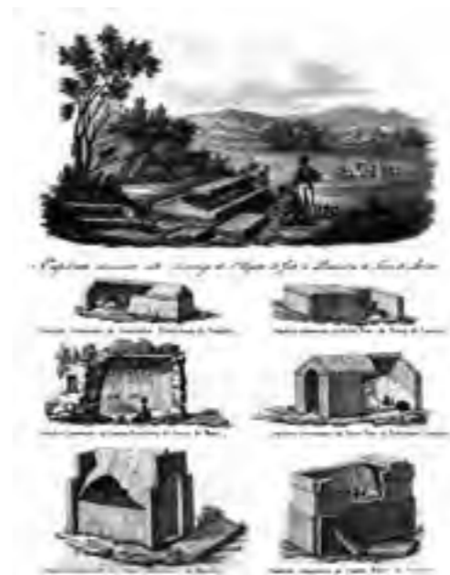
Fig. 7 Veduta di vari sepolcreti (da Gargiulo 1843, tav. 1)

Sempre a Münter si deve la nomina all'interno della commissione, nel 1816, del giovane Christian Jürgensen Thomsen (1788-1865), artefice pochi anni dopo del primo ordinamento scientifico del Museo e riconosciuto codificatore di quella suddivisione, oggi divenuta canonica, della preistoria in tre età fondate sulla valutazione di parametri oggettivi e contestuali quali l'evoluzione tecnologica della cultura materiale, passata dall'età della Pietra a quella del Bronzo e, infine, a quella del Ferro 69 . Mancano elementi certi per stabilire se possa esservi stato un rapporto diretto tra le intuizioni metodologiche e museografiche di Thomsen (che visitò Napoli solo nel 1846) e la tradizione antiquaria partenopea mediata da Münter 70 , ma non vi sono dubbi che la circolazione delle