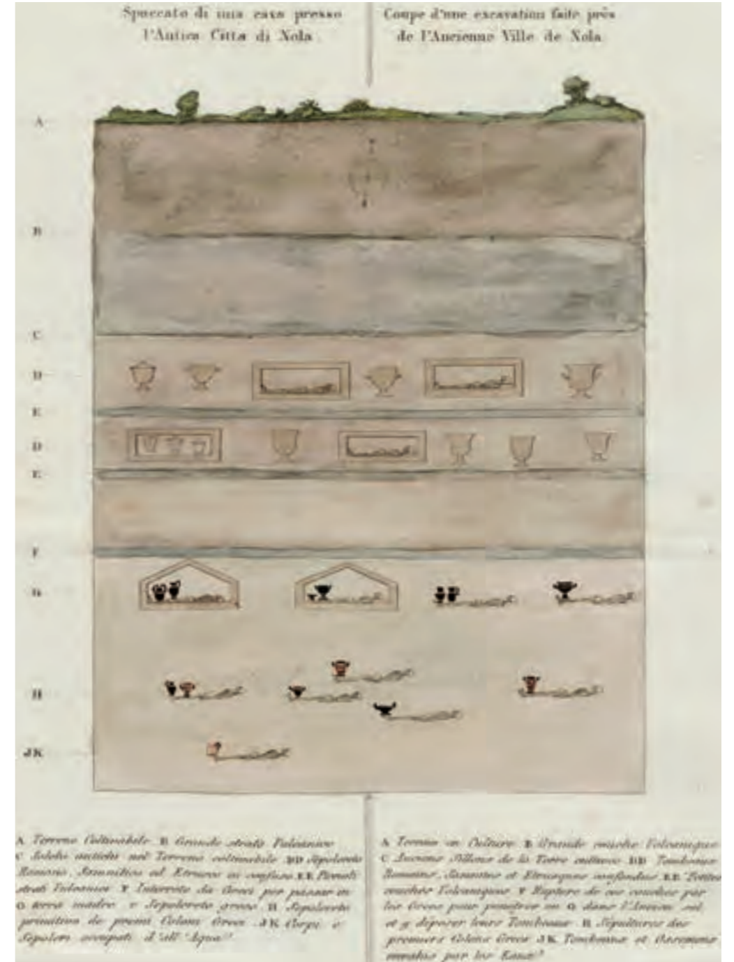
Fig. 6 Spaccato di una cava presso l'Antica città di Nola (da Dubois Maisonneuve 1817, pl. 101)

la deduzione, anche attraverso di essa, di una più precisa collocazione temporale dei prodotti dell'arte così come della cultura materiale. Con l'apparizione nel 1806 del saggio di Lanzi sui vasi antichi si apriva, come si è accennato, una stagione completamente nuova per lo studio degli Etruschi. Forte di un acume enciclopedico che gli aveva consentito di decifrare la loro lingua sin dal 1789 e di spaziare come pochi suoi contemporanei dalle arti antiche a quelle moderne, l'abate Luigi Lanzi fu infatti tra i massimi interpreti del metodo