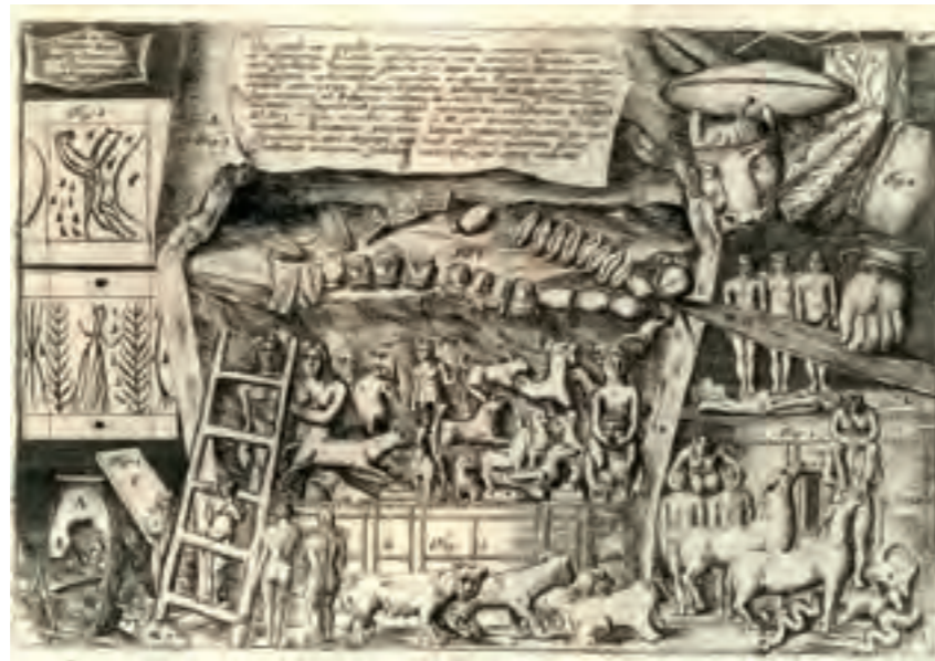
Fig. 2 Ripostiglio Bianchini (da Bianchini 1697, p. 178)

All'impossibilità di un riscontro diretto si cercava dunque di porre rimedio anche attraverso una maggiore perizia nella realizzazione degli apparati illustrativi e nella verifica della loro conformità agli originali, come dimostrava