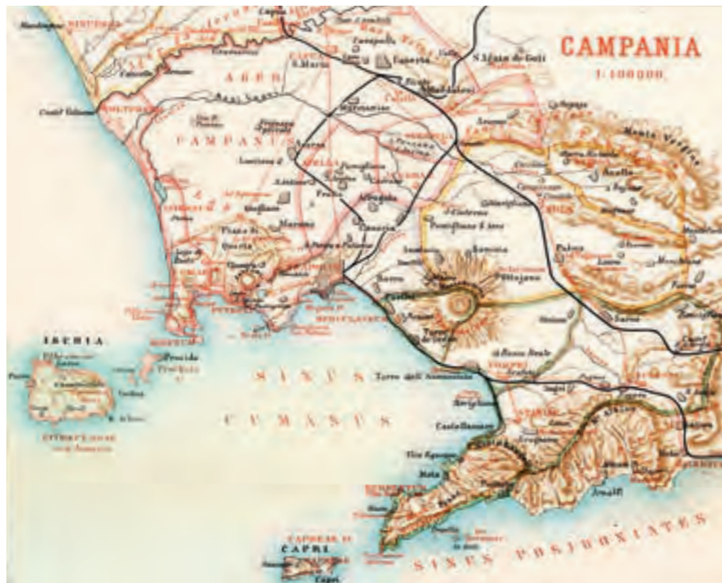
Fig. 11 Topografia storica della Campania (da Beloch 1890, pl. I)

di produzione si locale, ma la cui cronologia si spingeva di almeno un secolo oltre quella che la tradizione fissava (420 a.C.) per "la fine degli Etruschi in Campania" 195 . Le conclusioni erano dunque tracciate e tutto sembrava consentire di liquidare la questione come una mera favola 196 . Dovettero passare diversi anni perché vi fosse qualcuno in grado di contrapporre argomentazioni altrettanto forti e autorevoli. Nel frattempo, nel Lazio, in Toscana e in Emilia, le scoperte andavano avanti freneticamente e con esse progrediva la conoscenza delle fasi più antiche della storia etrusca e delle caratteristiche della loro cultura materiale. Dopo gli exploit di Suessula e di Cuma, le conoscenze sulle fasi preromane della Campania avevano invece cessato di progredire per ragioni connesse non solo al perdurare dei saccheggi e degli scavi incontrollati. Le relazioni promesse da Spinelli e Stevens tardavano infatti ad essere comunicate, nonostante le loro esplorazioni fossero andate avanti, con risultati anche notevoli la cui conoscenza, tuttavia, sarebbe rimasta preclusa ancora a lungo. Agli antichisti napoletani non rimaneva dunque che rifugiarsi retrospettivamente negli scavi d'archivio per tentare di recuperare quanto ancora poteva sopravvivere in quelle carte delle tante occasioni perse, come fece Fiorelli seguito poi