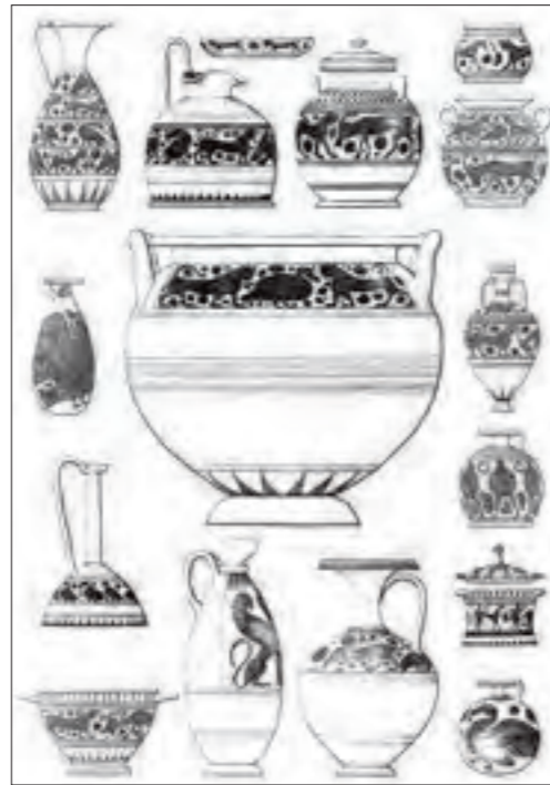
Fig. 8 Vasi assegnati alla prima epoca (da Gargiulo 1843 2 , tav. 11)

propri cataloghi di vendita . Da essi i potenziali acquirenti potevano trarre le coordinate necessarie per completare le proprie raccolte, avvalendosi al contempo dell'esperienza, della credibilità e della professionalità di chi, in qualità di "ajutante al Controlloro del Real Museo", avrebbe potuto coadiuvarli non solo come riconosciuto intenditore ma anche come fidato rivenditore.