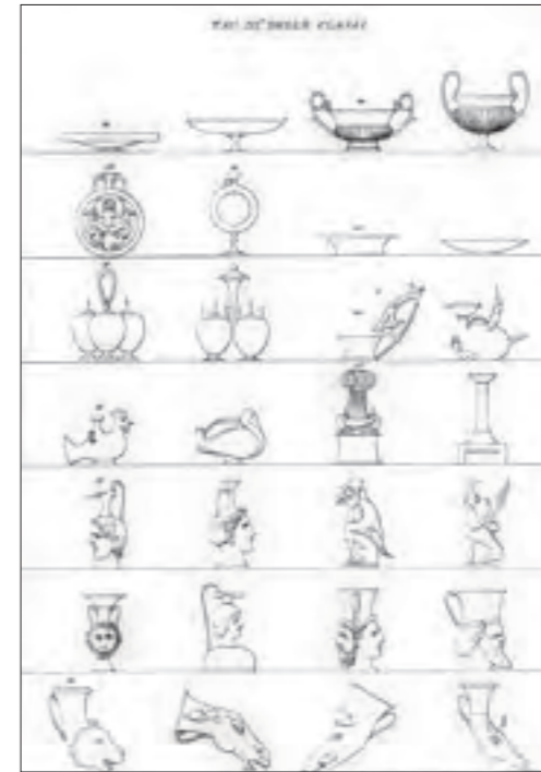
Fig. 9 Tav. III a delle classi (da Gargiulo 1843 2 , tav. 4)

falsificazioni, a restauri mimetici o alla vera e propria creazione di pastiche, come attesta il discreto repertorio di esemplari etruschi o etrusco-campani presentati in questa sede tra quelli custoditi nelle raccolte del MANN, ad esemplificazione del numero ancor più cospicuo che, grazie alla sua intermediazione, dovette essere all'epoca smerciato nelle maggiori collezioni europee 84 . Il tempo delle contraffazioni vascolari era appena iniziato ed è rilevante che a esserne oggetto fossero anche reperti di cui oggi riconosciamo, senza particolari difficoltà, la matrice etrusca. Ma non sono queste le uniche o le più gravi manipolazioni perpetrate in quegli anni; l'alterazione volontaria dei dati di scavo era praticata con altrettanta abilità e in forme tali da rendere molto difficile la ricomposizione delle circostanze di rinvenimento dei nuclei collezionistici più antichi, anche in presenza di testimonianze o documenti archivistici apparentemente affidabili 85 .