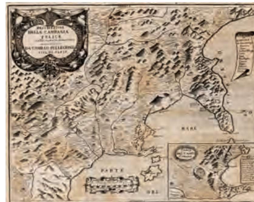
Fig. 1 Descrizione della Campania Felice (da Pellegrino Cam. 1651)

storica 5 . Nel De antiquissima Italorum sapientia ex Linguae Latinae Originibus eruenda (1710), per il tramite della lingua, le radici culturali della sapienza e, in particolare, della filosofia italiana venivano infatti ricondotte al magistero degli Etruschi, con il conseguente ridimensionamento dell'apporto dei Greci, che al loro arrivo nella Penisola l'avrebbero trovata assai meno barbara di quel che si era soliti immaginare: “ Hetruscos autem eruditissimam gentem fuisse, magnificorum doctrina sacrorum, qua praestabat, confirmat ” 6 . A distanza di oltre tre secoli le parole di Vico sembrano anticipare le più recenti acquisizioni compiute dall'archeologia postcoloniale nello studio delle culture preromane della Penisola 7 . L'idea stessa della Magna Grecia cominciava a essere ricondotta in un alveo storico ben più articolato di quanto si era fino ad allora immaginato, nel quale popolazioni anelleniche come gli Etruschi non dovevano aver giocato il semplice ruolo di comprimari ma avrebbero