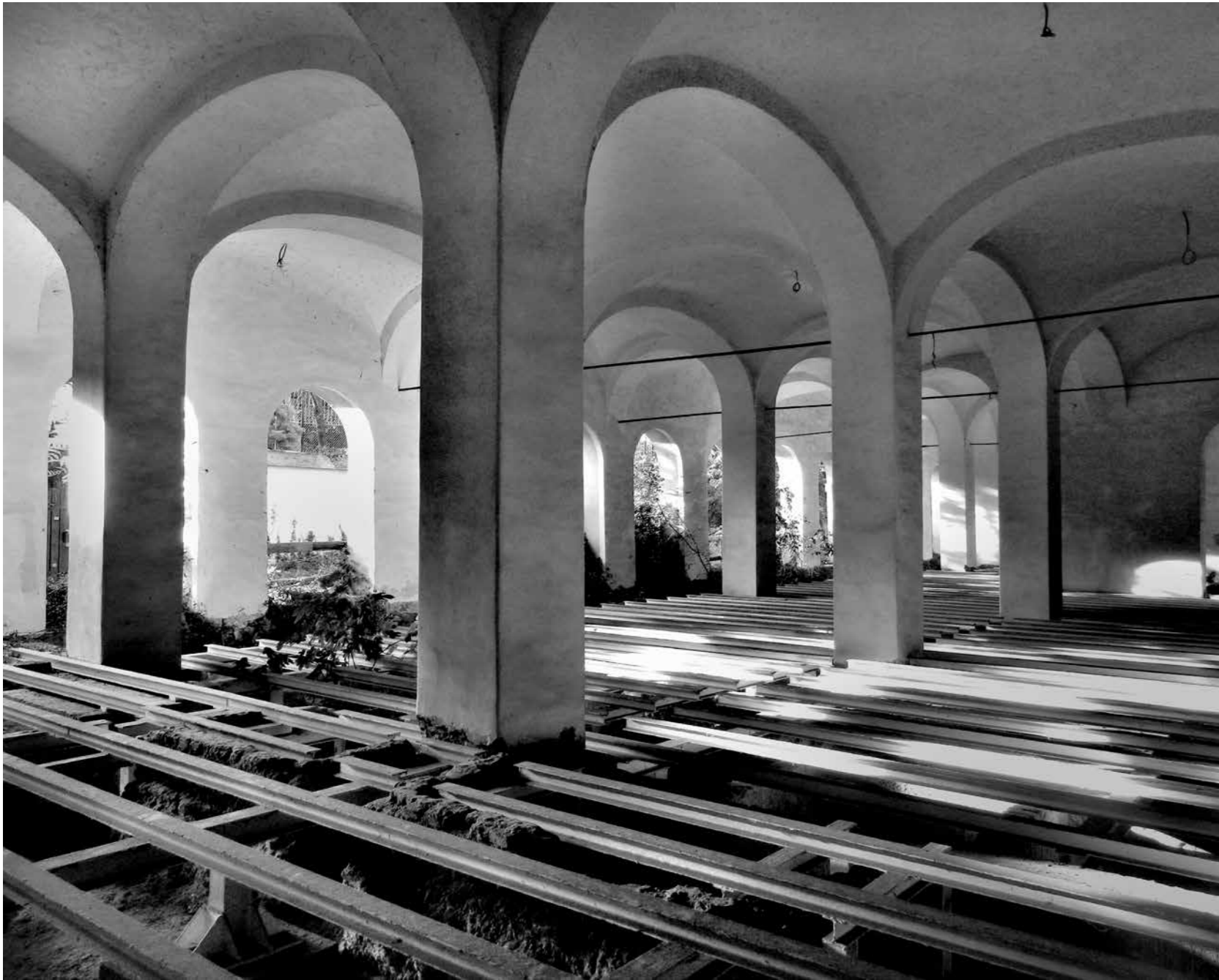
2. Complesso di Villa Poniatowski, ex concertie Riganti. Sala voltata delle vasche della concia. Si noti l'impalcato metallico, parte degli interventi del 2000 rimasti incompiuti (foto 2017).

ze preziose. I pensionamenti susseguirsi senza che si potesse dar luogo a efficaci passaggi di consegne tra le diverse "generazioni" di funzionari e tecnici, la non sempre efficace gestione e archiviazione dei flussi documentali, ulteriormente aggravata dalla non facile transizione dal sistema analogico a quello digitale sono solo alcune delle variabili che possono pesare sull'efficacia, l'efficienza e l'economicità della gestione amministrativa e tecnica di monumenti e istituti complessi e delicati come quelli in discorso, per i quali il capitale umano – insieme al suo bagaglio esperienziale – costituisce sempre un fattore determinante da tenere in maggior conto, ancor più quando si dà seguito ad ambiziose e delicate riorganizzazioni.