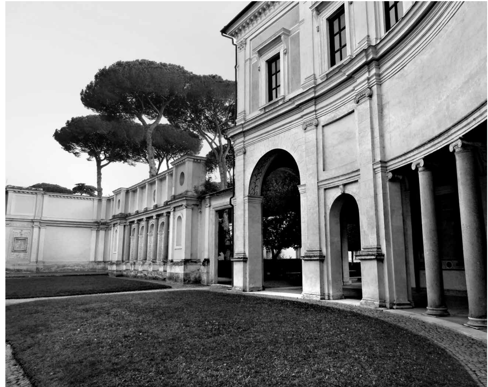
Villa Giulia. Corte interna (foto 2017).