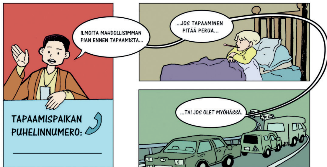
KUVA 1. Ohjeet tapaamisen perumiseen ja myöhästymistä ilmoittamiseen Valvotun tapaamisen säännöissä .

Kuvat sairaasta lapsesta ja autojonosta ovat esimerkkejä mahdollisista perumisen ja myöhästymisen syistä. Ne selittävät virkkeen sisältöä ja tukevat sen muistamista. Esitämme, että kyseinen tekstikohta on yleiskielistä tekstiä helpompi ymmärtää nimenomaan ilmaisun multimodaalisuuden ansiosta: sisältö esitetään yksinkertais-