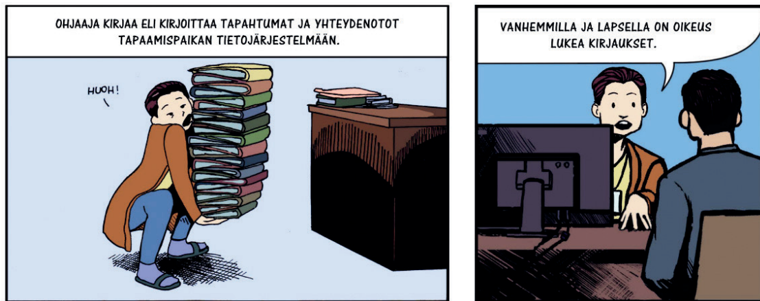
KUVA 5. Tieto kirjaamiskäytännöistä Valvotun tapaamisen säännöissä .

tekstiä. Symboleilla pyritään siis tukemaan ilmaisan konkretiaa myös sellaisissa tekstikohdissa, joissa ilmaistaan abstraktia sisältöä.