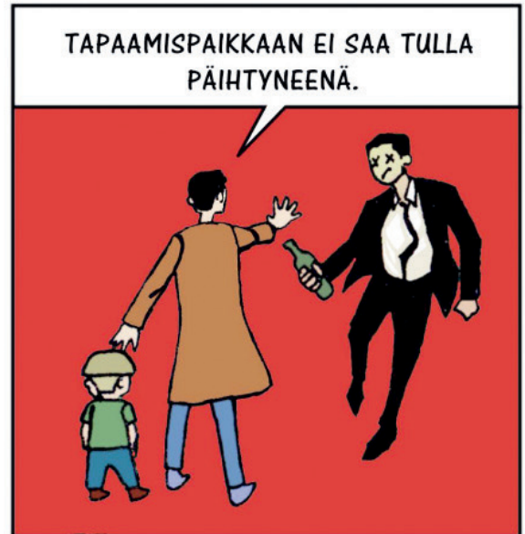
KUVA 2. Aggressiivinen hahmo Valvotun tapaamisen säännöissä. © Sarjis-tutkimusryhmä ja Jan Pitkäsalo.