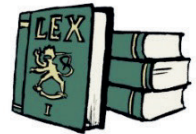
KUVA 4. Symboleja Valvotun tapaamisen säännöissä.

Sosiaalihuoltolaki 27 § Laki lapsen huollosta ja tapaamisoikeudesta 2 §