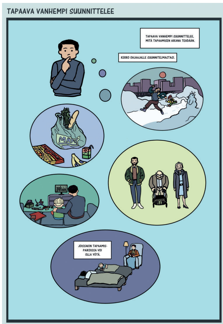
KUVA 6. Tapaavan vanhemmat suunnitteluohje Valvotun tapaamisen säännöissä. © Sarjistikutusryhmä ja Jan Pitkäsalo.

Sen lisäksi että tarkastellaan, mitä sisältöjä sarjakuva-asiakirjaan ylipäätään valitaan mukaan, on tutkittava myös, onko asiakirjaan jäänyt sisällöllisiä aukkoja ja ymmärtääkö lukija puhekupliin ja tekstilaatikoihin tiivistetyt tekstit. Tässä tarkastelussa on kuitenkin tärkeää muistaa sarjakuvan multimodaalinen muoto. Jos sarjakuvasta tarkastelee pelkkiä sanoja tai pelkkiä kuvia, voi hyvinkin vaikuttaa siltä, että kerronnassa on aukkoja. Tämän tyyppinen aukkoisuus on sarjakuvailmaisulle ominaista (ks. Borodo, 2015, s. 23), ja se kutsuu lukijaa yhdistelemään eri moodeista poimimaansa tietoa. Tämä sarjakuvailmaisun piirre liittyy myös seuraavan kriteerin tarkasteluun.