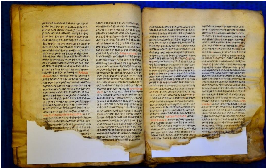
Codice manoscritto etiopico prima del restauro. Carte 33v-34r. Presenza di grandi lacune del supporto e del testo, strappi e gore di umidità.

The CaNaMEI Project: Rediscovering Ancient Ethiopian Manuscripts in Italian Libraries https://www.ipocan.it/index.php/it/canamei-2 (25/01/2025).