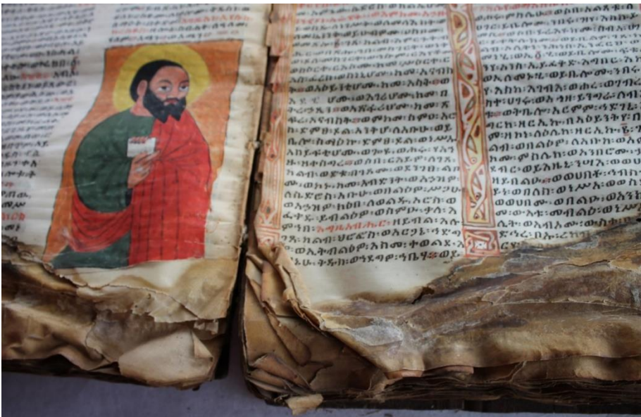
Esempio di carte membranacee adesive in maniera disordinata l'una all'altra a causa dell'apporto incontrollato di acqua ricevuto dal taglio inferiore del codice manoscritto. Carte 95v-96r.