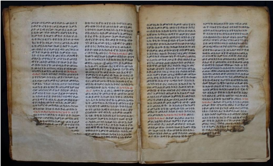
Codice manoscritto etiopico dopo il restauro. Carte 33v-34r. Lacune del supporto risarcite con carta giapponese di adeguato spessore e colore, fatta aderire con amido di grano precipitato Zin Shofu.