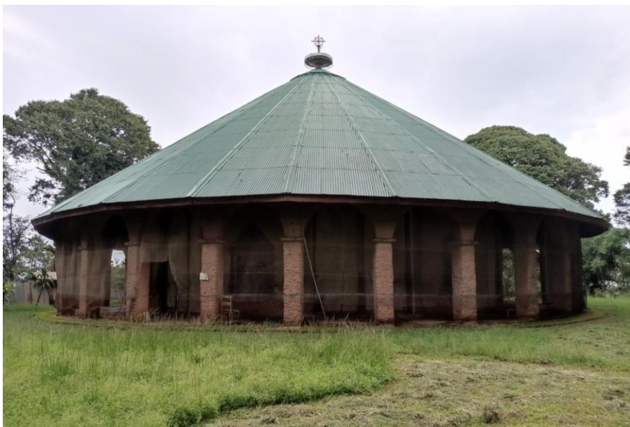
La chiesa dedicata all'arcangelo Gabriele, sull'isolotto di Kəbran, Lago Ṭana.