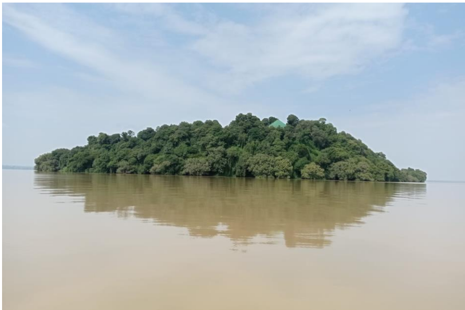
L'isolotto di Kəbran, presso la riva meridionale del Lago Ṭana.