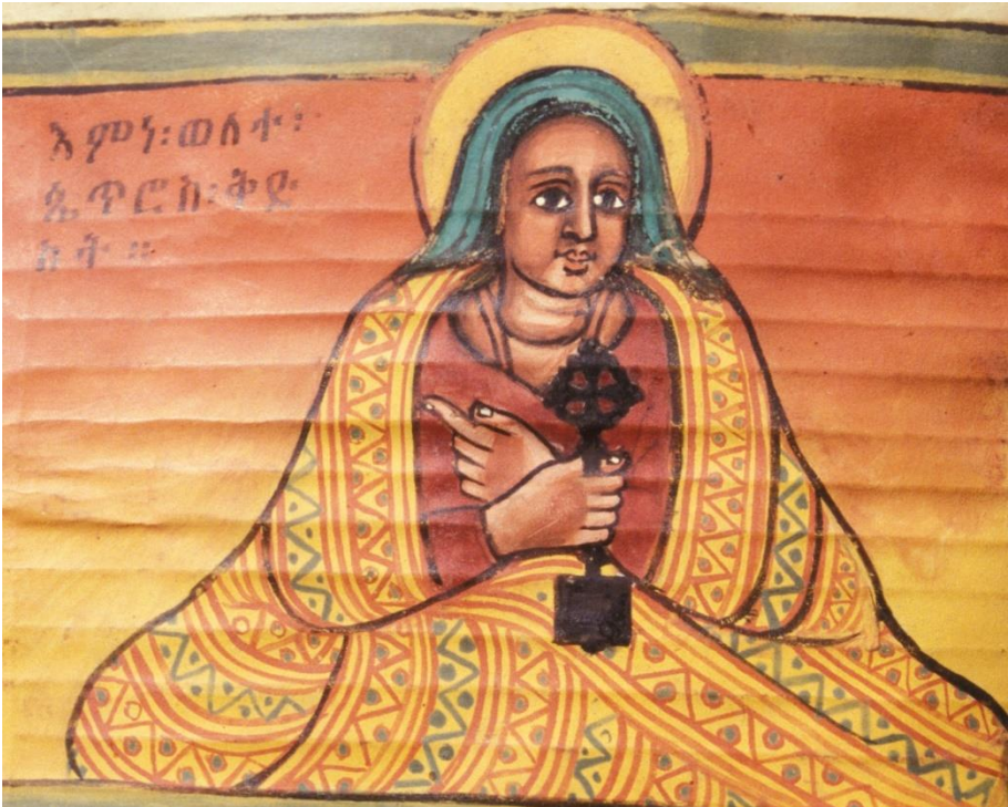
Ritratto della santa Wälättä Petros, ms. Tanasee 179 (= EMML 8448), f. 136v.