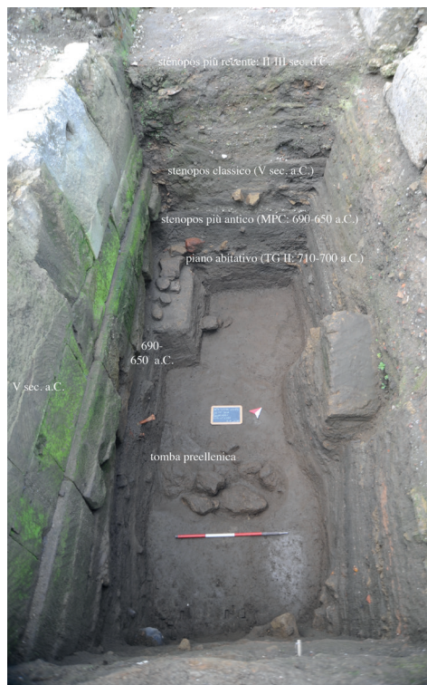
Fig. 4 – La stratigrafia messa in luce nel saggio condotto nello stenopos p.

metrico II pieno/avanzato 23 . Questi vasi, in buona parte legati al consumo del vino, erano ridotti in minuti frammenti e parti dello stesso individuo sono state trovate anche a distanza considerevole le une dalle altre. Ciò induce ad avanzare l'ipotesi che tali vasi avessero subito un'intenzionale rottura rituale. Che un sacrificio sia avvenuto è suggerito, parallelamente, dalle analisi dei numerosi reperti faunistici, che erano frammisti nella stratigrafia ai