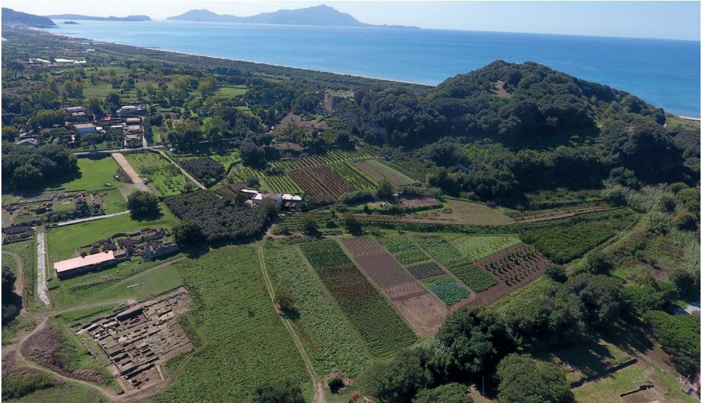
Fig. 1 – Cuma, il sito archeologico da nord-est: a sinistra l'abitato greco-romano, le Terme del Foro e il Capitolium; a destra la collina dell'acropoli; sullo sfondo Procida-Vivara e Ischia (© Università di Napoli L'Orientale).