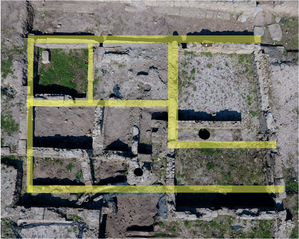
Fig. 5 – L'abitazione in opera quadrata di età classica, posta nell'angolo nord-orientale dell'isolato (elaborazione M. Giglio).

Tale unità abitativa sembra riprendere, almeno parzialmente, la planimetria di una casa a pastàs , dunque di una tipologia di edilizia domestica di età arcaica. Possiamo, allora, avanzare la suggestiva ipotesi che questa abitazione di età classica ricalchi nel suo perimetro un lotto alto-arcaico. Il lato settentrionale dell'abitazione presenta una larghezza di 12,54 m, mentre quello orientale di 8,25 m; la superficie occupata è di ca. 105,85 m 2 .