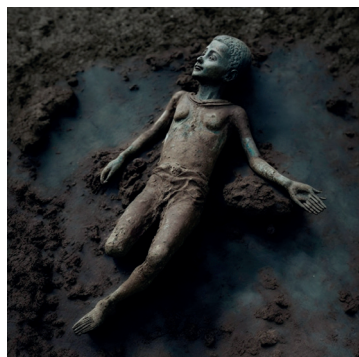
Fig. 1: “Polidattilo di San Casciano dei Bagni”: immagine realizzata da F. Ajello con l’AI all’indomani della scoperta e divenuta virale come fosse un reperto originale

Solo così si può sperare che alla pulsione per la strumentalizzazione mediatica dell'ennesima scoperta straordinaria possa subentrare l'etica della condivisione tempestiva – in passato colpevolmente limitata per logiche spesso opposte ai principi di democratizzazione della cultura – di una nuova acquisizione scientifica, la cui importanza possa essere restituita al pubblico in forma debitamente contestualizzata e in tutta la sua reale portata storica, culturale e metodologica, dando adeguato risalto alle professionalità che hanno contribuito a rivelarla. Questo impone una capacità di mediazione con i giornalisti e una piena consapevolezza dei meccanismi che regolano i vari possibili canali di comunicazione, tale da evitare o, almeno, limitare i condizionamenti spesso anche ideologici che possono alterare irrimediabilmente la qualità di un messaggio che dovrebbe sempre fondarsi su presupposti scientifici.