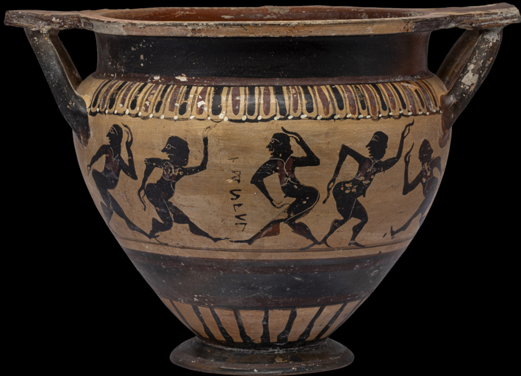
Etruskisch-schwarzfigurig Säulenkrater, 3. Viertel des 6. Jahrhunderts v. Chr. ETRU, Collezione Castellani (Inv. Nr. 50720)