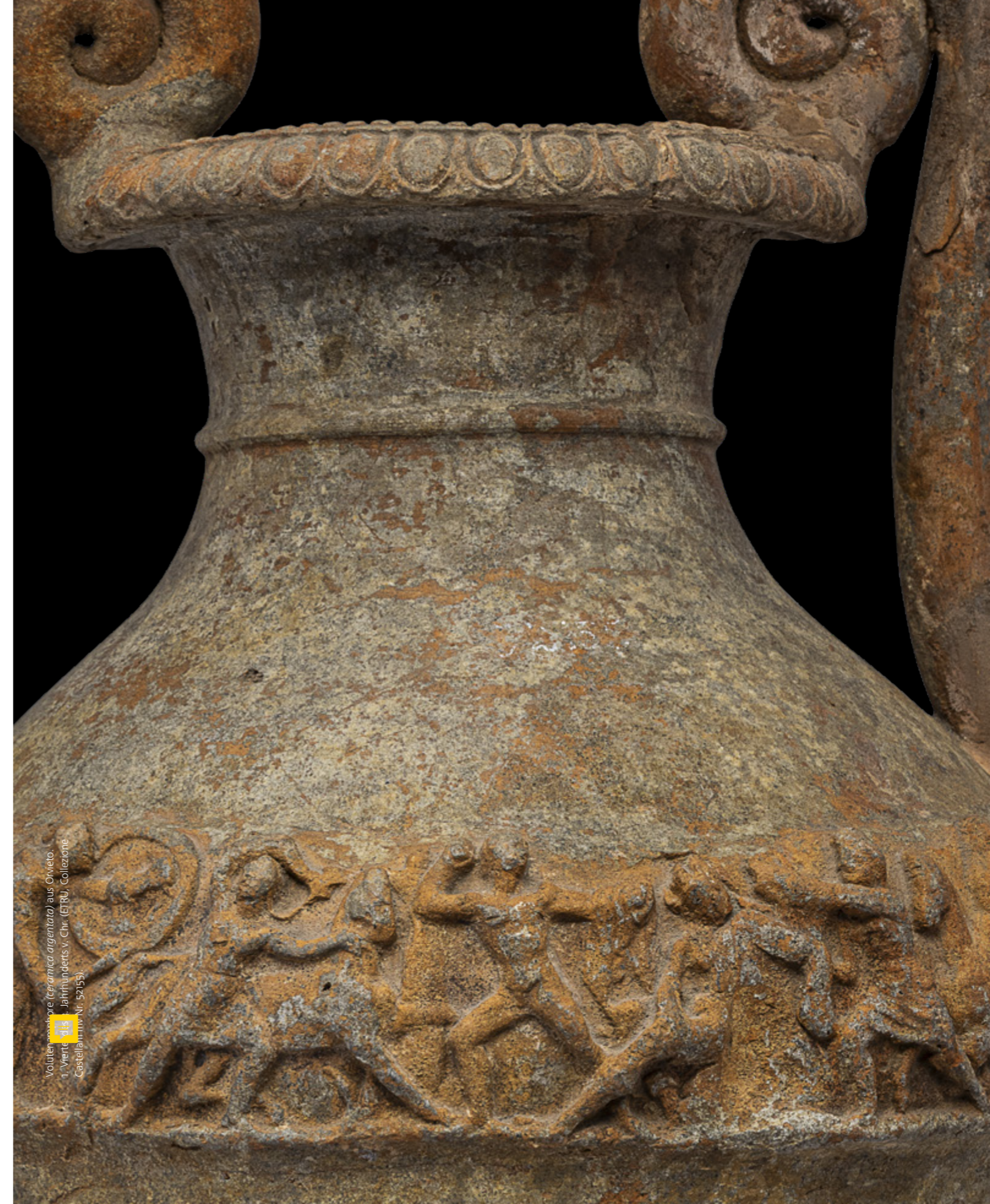
Voluten (Ceramica argintata) aus Orvieto. 1. Viertel des 1. Jahrhunderts v. Chr. (ETRU), Collezione Castellani inv. Nr. 52153.