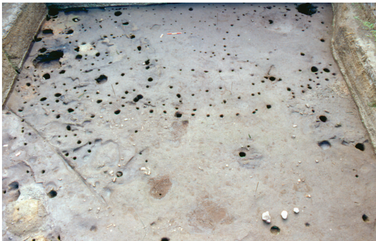
Fig. 57 – Fase finale dell'esplorazione del villaggio 2. Serie di fori di pali con andamento vario e di diverse dimensioni relativa prevalentemente ad un livello 1C riferibile ad un momento anteriore all'abbandono delle capanne 5 e 6. A destra della figura resti del pavimento di concotto della capanna 6.