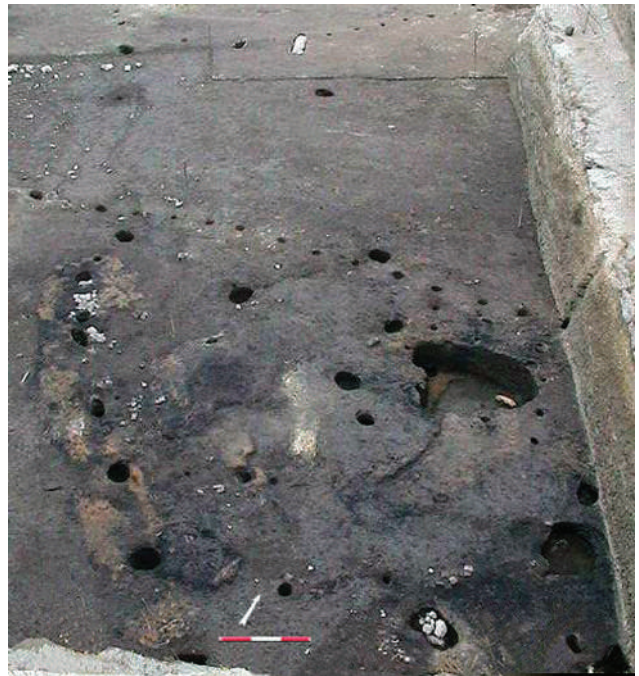
Fig. 55 - Capanna 5 - Sul pavimento abbondanti resti lignei carbonizzati.

Sono state individuate 11 buche di palo perimetrali, di forma circolare e subellittica, con un diametro medio di 24 cm e 4 buche relative ai pali