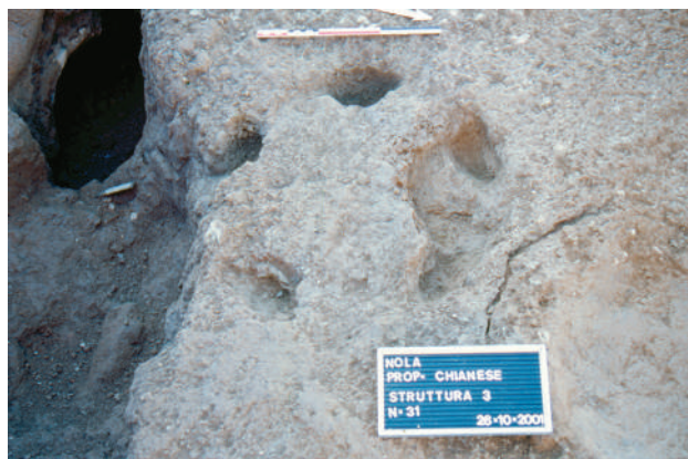
Fig. 58 – Impronta in negativo dei cinque piedi di un elemento sopraelevato.

Nei QQ. A3/4/5/6, \alpha 3/4/5/6 si sono evidenziate un'estensione del deposito carbonioso ed ampie tracce di un pavimento rubefatto riferibili ad un'altra capanna ( capanna 6 ) orientata in modo leggermente diverso dalla capanna 5 , dalla quale distava circa 4 m. Pure questa struttura, che s'inoltrava purtroppo per buona parte sotto la sponda est del limite di scavo, era ricoperta da ampie lenti di terreno carbonioso e legni bruciati, con, in più, abbondante materiale ceramico e osseo abbandonato sul piano carbonioso (UUSS46 e 46 inferiore). Il piano di calpestio, corrispondente ad un livello di concotto (US55), è stato parzialmente esplorato; di questa struttura erano ben riconoscibili almeno 4 pali perimetrali di diametri variabili sul margine est e 4 grosse buche corrispondenti ai pali assiali; di dimensioni maggiori rispetto alla capanna 5 , dovrebbe avere avuto, secondo la ricostruzione