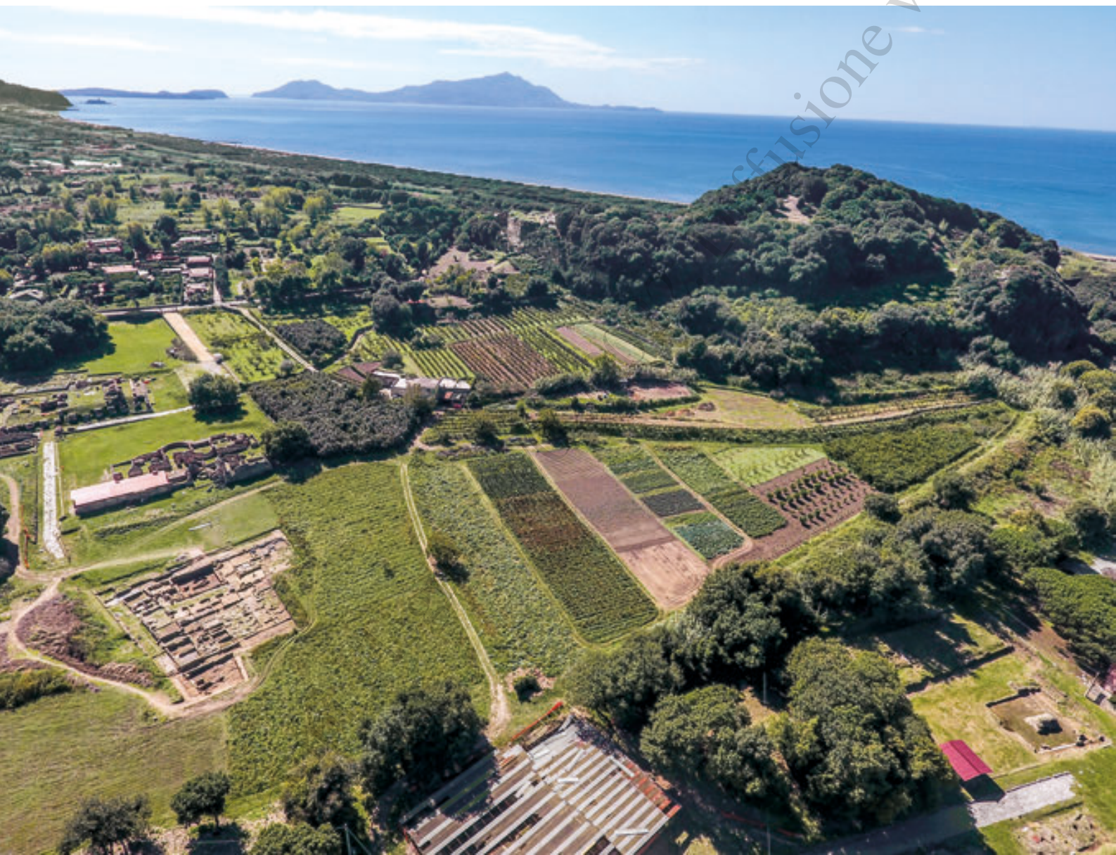
1. Il sito visto da Nord-Est: in primo piano l'area delle mura e sulla sinistra il settore dell'abitato greco-romano a Nord delle Terme del Foro, sullo sfondo Ischia e Procida