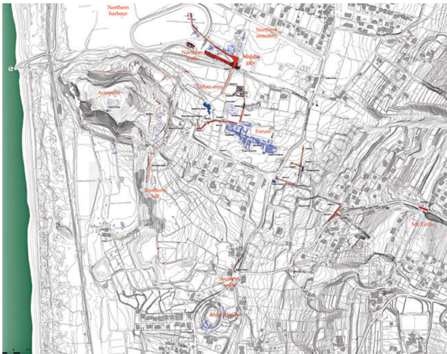
2. Planimetria generale del sito (elaborazione: Università degli Studi di Napoli L'Orientale)

ATTRAVERSO LA STORIA: DAL VILLAGGIO PRE-ELLENICO, ALLA COLONIA GRECA, ALLA CITTÀ CAMPANA, AL PERIODO ROMANO