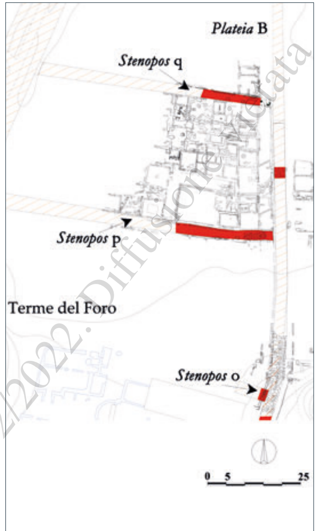
5. L'isolato messo in luce a Nord delle Terme del Foro, scavi 2001, 2007-2021

sensibile inclinazione da Sud verso Nord e da una più lieve pendenza da Sud-Ovest verso Nord-Est. Tali irregolarità del sistema viario risultano evidenti dall'andamento non ortogonale degli stenopoi p e q rispetto alla plateia B e dal cambio di orientamento di quest'ultima in corrispondenza dell'angolo Nord-Est delle Terme del Foro (inizi del II sec. d.C.), che hanno determinato di conseguenza la forma irregolare degli isolati. Le pendenze di questo settore della città sono state sapientemente sfruttate per lo smaltimento delle acque reflue, fatte defluire, attraverso il sistema viario, all'esterno delle mura, fino alla laguna di Licola 29 .