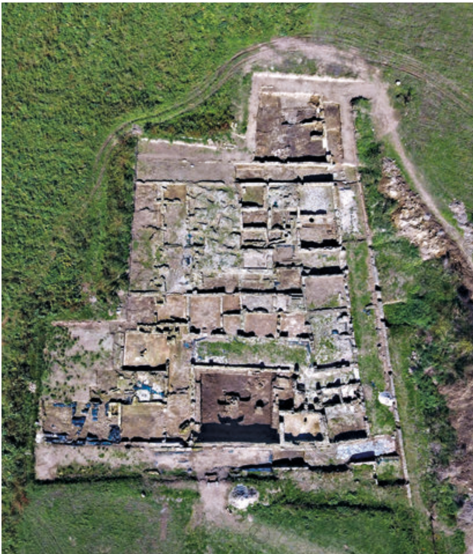
6-7. Il settore dell'abitato greco-romano messo in luce a Nord delle Terme del Foro: a sinistra l'intera area di scavo e a destra la domus a peristilio meridionale; in basso è visibile il saggio condotto nello stenopos p

VII sec. a.C. Le indagini effettuate nello stenopos p e all'interno dell'isolato stesso hanno chiaramente dimostrato che tra la fondazione dell' apoikia greca, avvenuta intorno alla metà dell'VIII sec. a.C., e la messa in opera dell'impianto urbano agli inizi del VII sec. a.C., vi è una lunga fase intermedia, che copre forse un arco temporale di due generazioni: ciò restituisce l'immagine della complessità e della diacronia con cui si è svolto il processo di colonizzazione, processo che non può essere certo immaginato come cristallizzato ad un singolo momento iniziale. Dagli scavi in questo settore risulta, inoltre, evidente che la maglia stradale così definita verrà rispettata senza modifiche sostanziali fino ad epoca imperiale avanzata (III-IV sec. d.C.) e che la plateia B resterà anzi in uso fino ad età tardo-antica (V-VI sec. d.C.). Tale peculiare circostanza offre la preziosa opportunità di leggere in filigrana, attraverso il sistema viario di epoca romana, l'urbanistica della Cuma greca alto-arcaica. Le recenti indagini restituiscono, dunque, una rara testimonianza del segmento di un impianto urbano coloniale, in un momento di poco successivo alla fondazione dell' apoikia 30 . Il caso di Cuma va così ad affiancarsi a quelli meglio noti e più