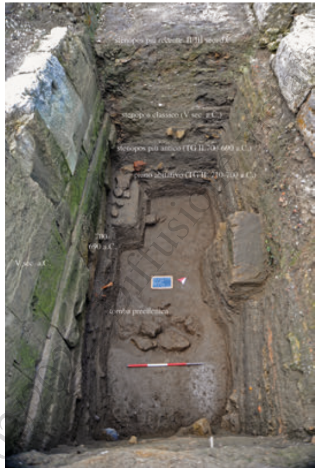
8. Il saggio stratigrafico condotto nello stenopos p, da Est

Se in alcuni casi l'intervento di ristrutturazione in opera quadrata di epoca classica ha comportato una significativa trasformazione planimetrica degli ambienti, in altri sembra possibile riconoscere una certa continuità con la fase arcaica. Ciò è ben visibile nell'abitazione posta nell'angolo nord-orientale dell'isolato, la cui planimetria sembra riprendere quella di una casa a pastàs/pseudo-pastàs di epoca arcaica, caratterizzata da dimensioni che potrebbero riflettere grosso modo l'estensione di un originario oikopedon 33 . L'abita-