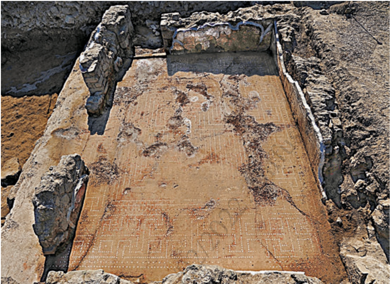
9. Pavimento in opus signinum di uno degli ambienti affacciati sul peristilio della domus tardo-repubblicana (foto di M. D'Acunto)

zione presenta un lungo ingresso orientato in senso Est-Ovest, che è aperto sulla plateia B e che conduce a Sud ad una piccola corte e a Nord a tre ambienti disposti in asse fra loro.