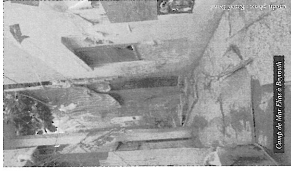
Camp de Mar Elias à Beyrouth

1 : L'UNRWA, soit l'acronyme en anglais de l'Office de secours et de travaux des Nations Unies pour les réfugiés de Palestine, est l'agence onusienne créée en 1949 afin de fournir des services de base (écoles, instruction obligatoire et soins de santé) aux réfugiés les plus démunis et à leurs descendants.