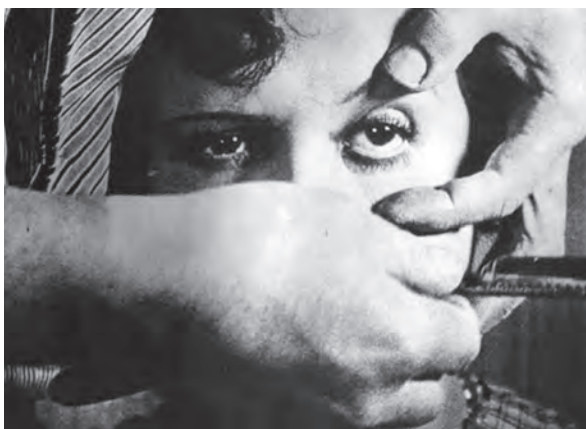
Fig. 4. – Fotogramma dal film di Luis Buñel «Un chien andalu» (1929).

Proprio nella parte iniziale del racconto Mutterzunge si parla di un taglio laddove si narra del viaggio in Alemania . La madre evidenzia, allora, una scissione dell'io narrante che si trasmette al suo modo di parlare: