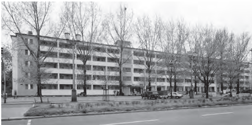
Fig. 3. – Laubenganghaus , « Karl Marx Allee », Berlin.

Il quartiere di Friedrichshain , dove si trova la casa in cui viene ospitata e in particolar modo proprio la Frankfurter Allee , è la zona che più risente dell'influsso del modello dell'architettura staliniana nella pianificazione urbanistica durante il regime della DDR (Fig. 3 91 ). Ancora oggi è possibile notare una differenza fondamentale tra Est e Ovest già a partire dalla toponomastica della città, laddove i nomi delle strade a Ovest si riferiscono per lo più a luoghi geografici mentre, a Est si tratta quasi sempre di personaggi storici e legati all'ideologia politica della DDR. Così la Mühsamstraße , anche per l'io narrante, non è solo la strada che la conduce alla Volksbühne , ma è anche la strada che ricorda Erik Mühsam, «der von den Nazis so grausam getötet war» 92 . Questa modalità di percezione e rappresentazione dello spazio urbano mostra anche la capacità di decifrare il codice della città per creare una sua mappa personale 93 . Attraversando la città l'io narrante cartografa lo spazio costruendo delle mappe, dei «moderni» portolani in cui si ritrovano le informazioni inerenti alla storia e ai costumi delle regioni raffigurate. Camminando la scrittrice si appropria dello spazio urbano, ma è attraverso la narrazione che costruisce la sua cartografia personale.