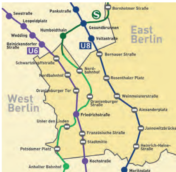
Fig. 5. – Berlino: mappa delle stazioni fantasma.

Parlando del suo rapporto con Berlino, l'autrice racconta di aver visitato la città per la prima volta nel 1988. A quel tempo aveva la possibilità di attraversare i confini senza problemi, in alcuni giorni poteva capitarle di passare il confine per ben cinque volte. Forte è il ricordo legato alla linea della metropolitana U6, che attraversava senza fermarsi le così dette Geisterstationen / stazioni fantasma (Fig. 5) come la Stadion der Wetljugend e la Schwartzkopfstrasse 74 .