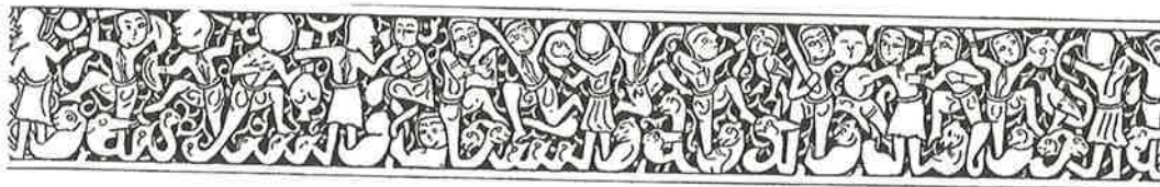
Fig. 3. Iscrizione figurata dalla "Wade Cup", da Rice 1955.

to, di produzione khorasanica e datato 1170–1220 ed è caratterizzato da una forma analoga all'esemplare napoletano sopra citato. Reca sul piede un'iscrizione con aste sormontate da testine umane. Quanto alla "Wade Cup" realizzata tra il 1220 e il 1225, essa segna l'estrema evoluzione della tradizione scrittoria figurata, utilizzando diverse forme di scrittura: quella con teste umane, quella "zoomorfa" e quella "animata". L'epigrafe principale, in cui è raffigurata una scena di combattimento o di caccia, è di assai complessa lettura e bisogna rendere merito a Rice della sua particolare sagacia nel percepire un ductus in ciò che appare a un'indagine non approfondita solo come un unico fregio figurativo (Fig. 3). 17