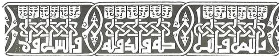
Fig. 1. Iscrizione figurata del Vaso Rota, da LANCI 1845–46, III, Tav. XXIX.

Infine, un'altra questione rilevante è quella delle ragioni dell'assenza di questa tipologia epigrafica nell'arte libraria selgiuchide, per altro studiata a sua volta come modello — piuttosto che punto di arrivo — degli ornati presenti negli oggetti metallici. 5 In tal senso andrà notata una differenza sostanziale con le tradizioni occidentali e quelle armena e bizantina che invece vuoi in forma di iniziale figurata, vuoi in forma di veri e propri alfabeti fecero ampio impiego di scritture animate.