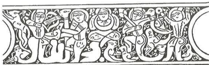
Fig. 4b. Iscrizione dalla "Coppa di Fano", da Rice 1955.

Le ragioni della sparizione della scrittura figurata e dunque del ritorno a uno stile epigrafico sobrio e protocollare, improntato alla fortuna della scrittura monumentale tulut in epoca mamelucca, con evidenti riferimenti all'epigrafia monumentale, sembrerebbe derivare da un più complessivo rifiuto di parte dell'eclittismo selgiuchide. 22 Sul versante mongolo invece, la pur consistente continuità nella produzione artistica di temi e tecniche peculiari del periodo selgiuchide, vide in buona sostanza, l'esclusione materiale di questa manifestazione importante dell'arte islamica.