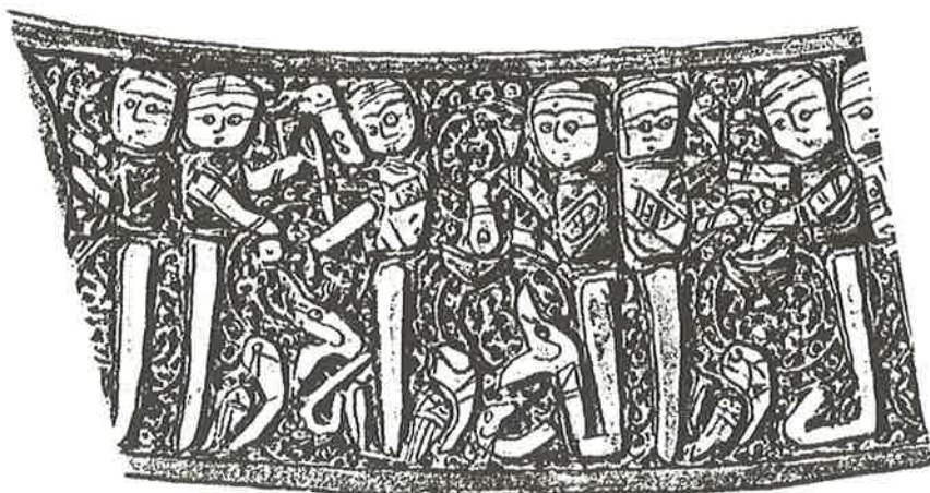
Fig. 2. Iscrizione dal Secchiello Bobrinsky, da Ettinghausen 1957.

Da quell'oggetto precursore si viene a formare un'evoluzione naturale del processo creativo che caratterizza la breve stagione della scrittura figurata su metallo e, pur in forma sintetica, segnaliamo qui le fasi successive del procedere di questa tradizione espressiva: essa compare in un portapenne realizzato a Marv (altra città del Khorasan, storico, od. Turkmenistan), oggi nella Freer Gallery of Art (Washington Freer Gallery of Art, nr. 36.7) in cui la stessa firma dell'artigiano, Šādī, è composta con lettere figurate. La data suggerita dagli studiosi è il 1210. 14 Le collezioni italiane, annoverano alcuni importanti esemplari decorati con scritture figurate: tale è una coppa in Bronzo con iscrizione ageminata in argento conservata a Napoli presso il Museo di Capodimonte (inv. n. 112114), databile tra i secoli XII e XIII e firmata da Ḥalaf b. al-Julākī, caratterizzata da una fascia epigrafica in scrittura nashī in cui le lettere sono sormontate da teste umane. 15 Allo stesso periodo è attribuita una splendida brocca anch'essa khorasanica — analoga per tipologia alla Brocca "Rota" — conservata nella Galleria Estense a Modena (inv. nr. 6921), in cui su vari registri compaiono iscrizioni figurate vuoi in caratteri nashī , vuoi in cufica. 16