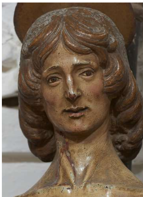
Fig. 11. Silvestro dell'Aquila, San Sebastiano , Rocca di Mezzo, chiesa di Santa Maria ad Nives, particolare