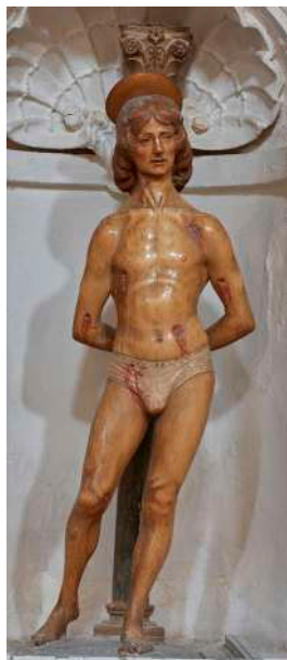
Fig. 5. Silvestro dell'Aquila, San Sebastiano , Rocca di Mezzo, chiesa di Santa Maria ad Nives, particolare