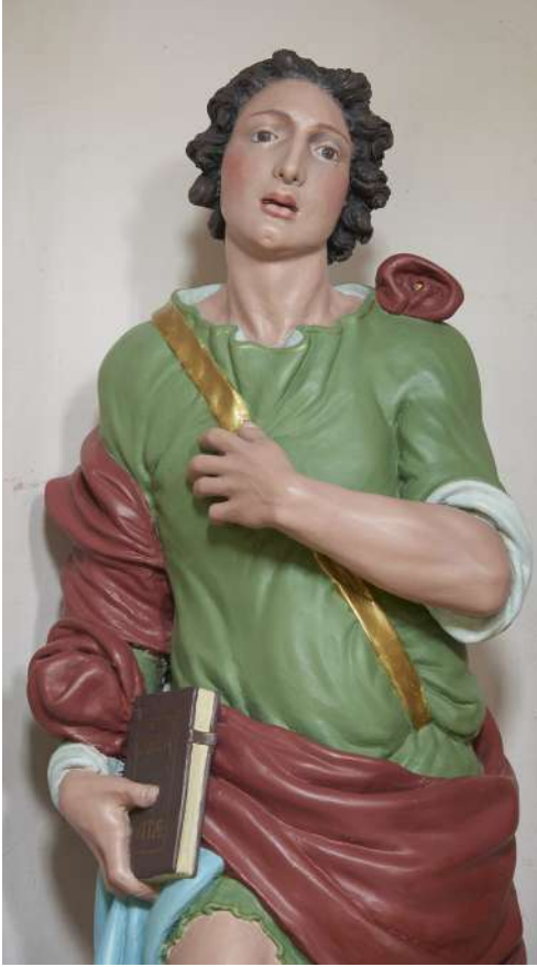
Fig. 34. Saturnino Gatti, San Vito , Colle San Vito di Tornimparte, chiesa di San Vito, particolare