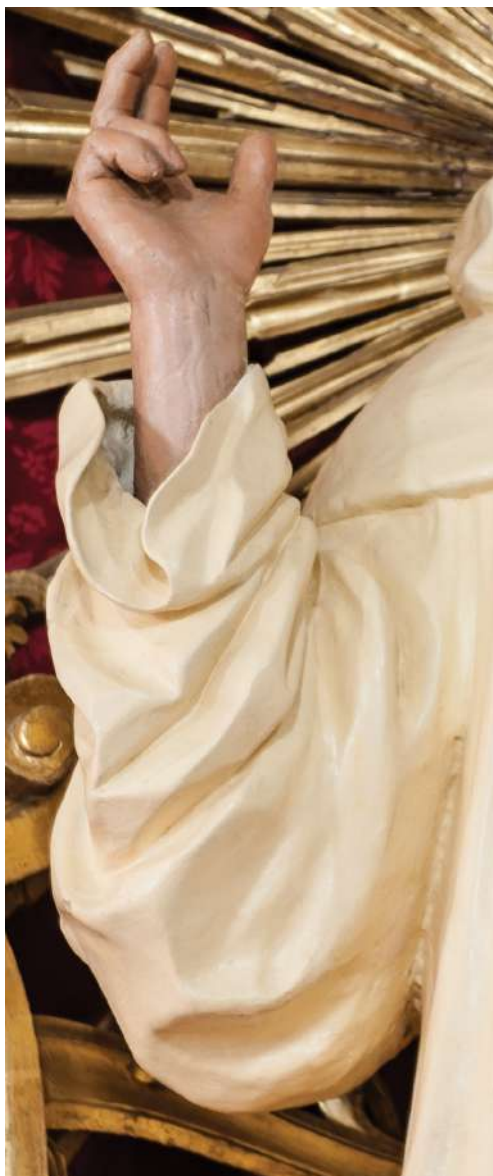
Fig. 37. Saturnino Gatti, Sant'Egidio , Orte, chiesa di Santa Maria Assunta, particolare