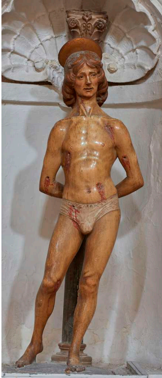
Fig. 1. Silvestro dell'Aquila, San Sebastiano , Rocca di Mezzo, chiesa di Santa Maria ad Nives