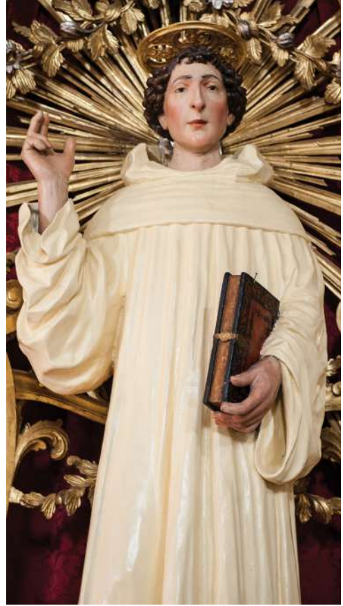
Fig. 35. Saturnino Gatti, Sant'Egidio , Orte, chiesa di Santa Maria Assunta, particolare