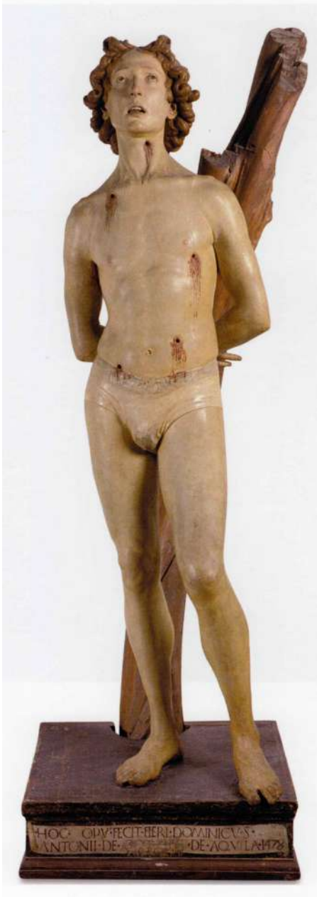
Fig. 8. Silvestro dell'Aquila, San Sebastiano , L'Aquila, Museo Nazionale d'Abruzzo (ora a Celano, Castello Piccolomini)