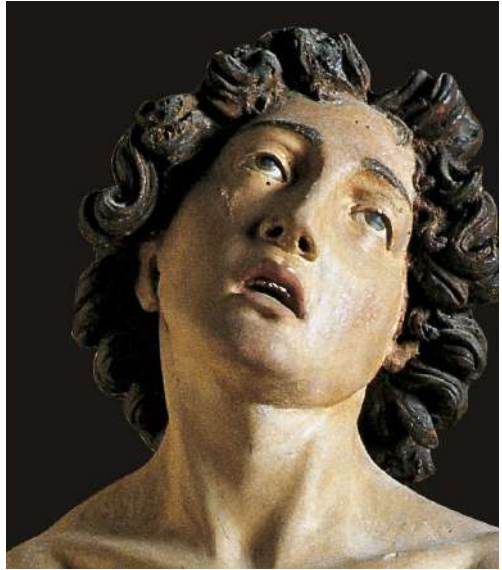
Fig. 30. Saturnino Gatti, San Sebastiano , L'Aquila, Museo Nazionale d'Abruzzo (ora a Celano, Castello Piccolomini), particolare