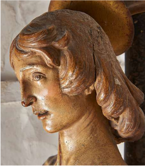
Fig. 15. Silvestro dell'Aquila, San Sebastiano , Rocca di Mezzo, chiesa di Santa Maria ad Nives , particolare