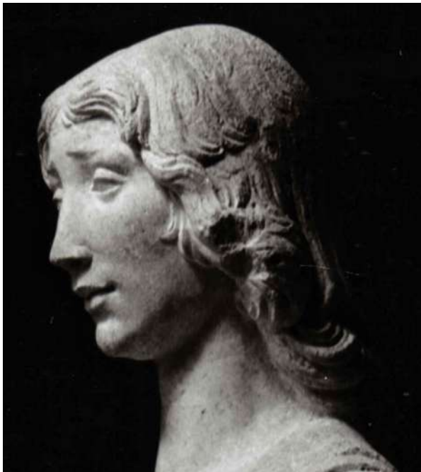
Fig. 16. Silvestro dell'Aquila, San Giovanni evangelista , collezione privata, particolare