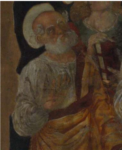
Fig. 25. Saturnino Gatti, Santi e beati , Villagrande di Tornimparte, chiesa di San Panfilo, particolare