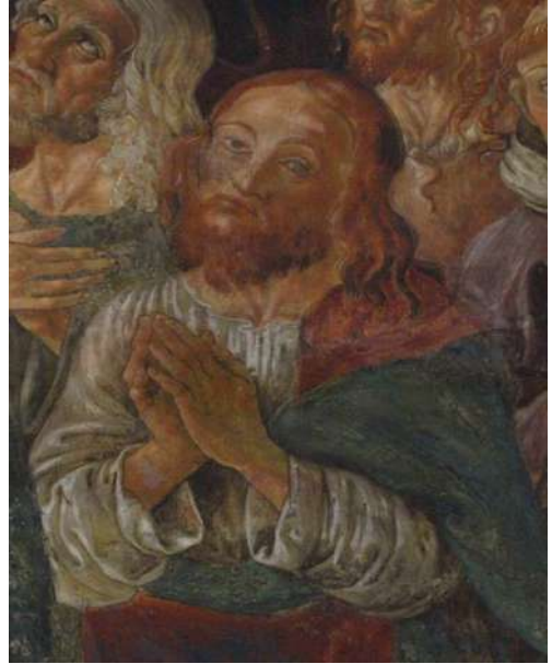
Fig. 26. Saturnino Gatti, Santi e beati , Villagrande di Tornimparte, chiesa di San Panfilo, particolare