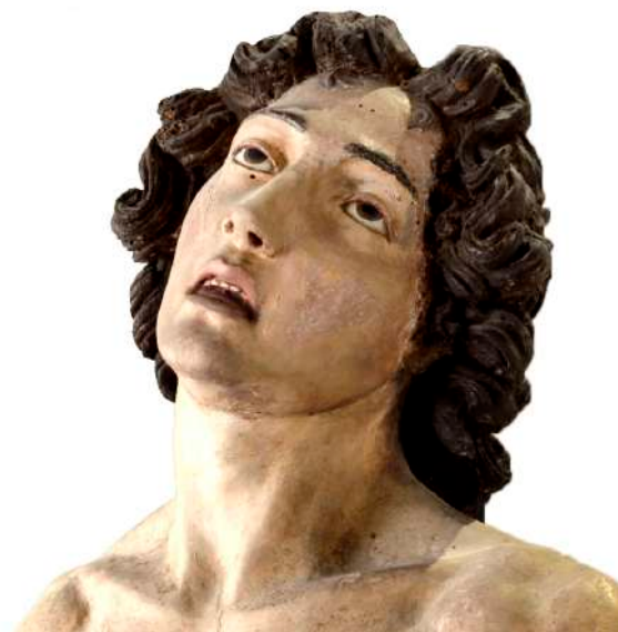
Fig. 33. Saturnino Gatti, San Sebastiano , L'Aquila, Museo Nazionale d'Abruzzo (ora a Celano, Castello Piccolomini), particolare