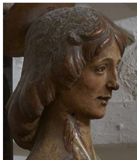
Fig. 13. Silvestro dell'Aquila, San Sebastiano , Rocca di Mezzo, chiesa di Santa Maria ad Nives, particolare