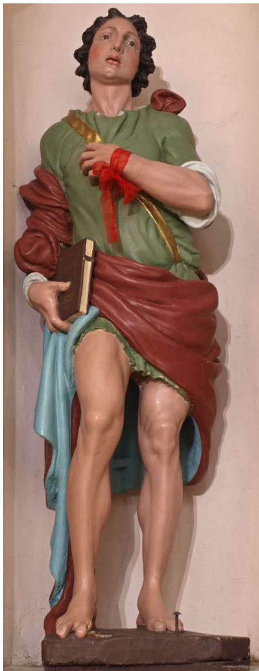
Fig. 17. Saturnino Gatti, San Vito , Colle San Vito di Tornimparte, chiesa di San Vito