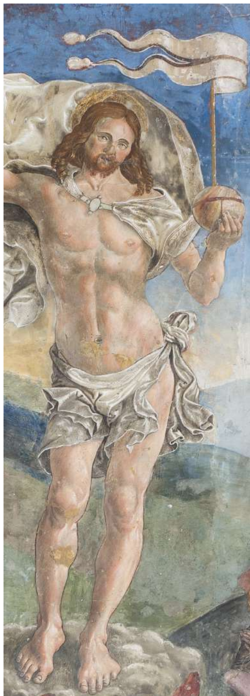
Fig. 18. Saturnino Gatti, Resurrezione di Cristo , Villagrande di Tornimparte, chiesa di San Panfilo, particolare