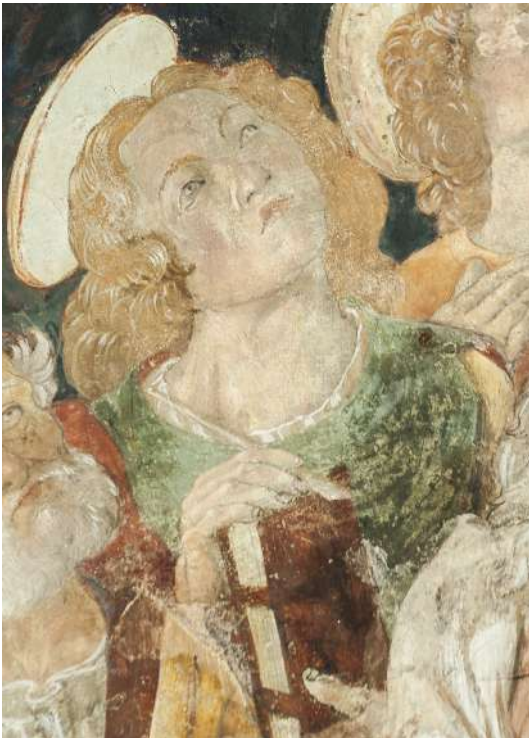
Fig. 31. Saturnino Gatti, Santi e beati , Villagrande di Tornimparte, chiesa di San Panfilo, particolare