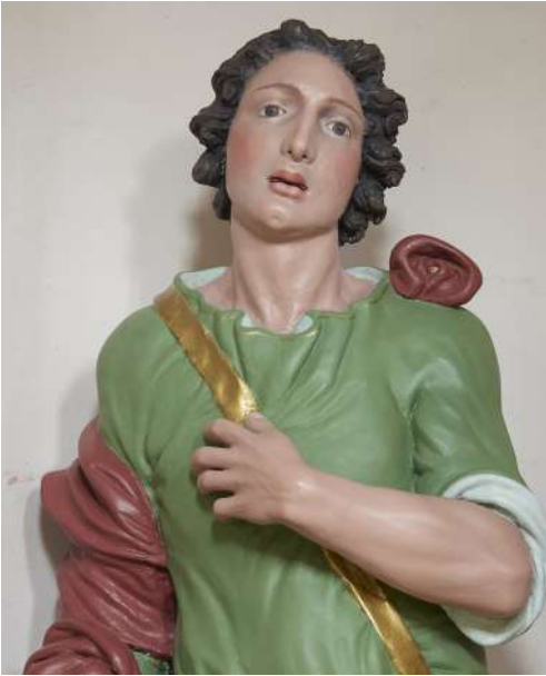
Fig. 23. Saturnino Gatti, San Vito , Colle San Vito di Tornimparte, chiesa di San Vito, particolare