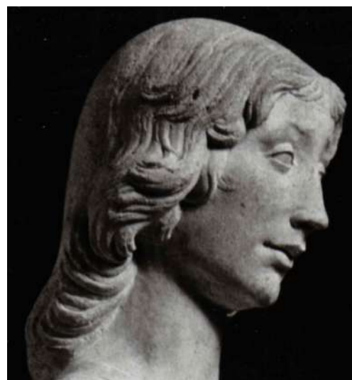
Fig. 14. Silvestro dell'Aquila, San Giovanni evangelista , collezione privata, particolare