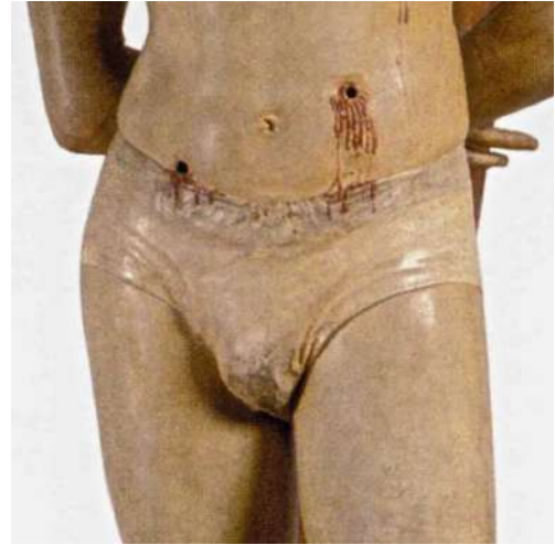
Fig. 10. Silvestro dell'Aquila, San Sebastiano , L'Aquila, Museo Nazionale d'Abruzzo (ora a Celano, Castello Piccolomini), particolare