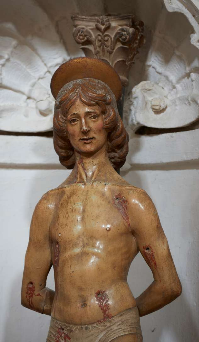
Fig. 4. Silvestro dell'Aquila, San Sebastiano , Rocca di Mezzo, chiesa di Santa Maria ad Nives ; particolare