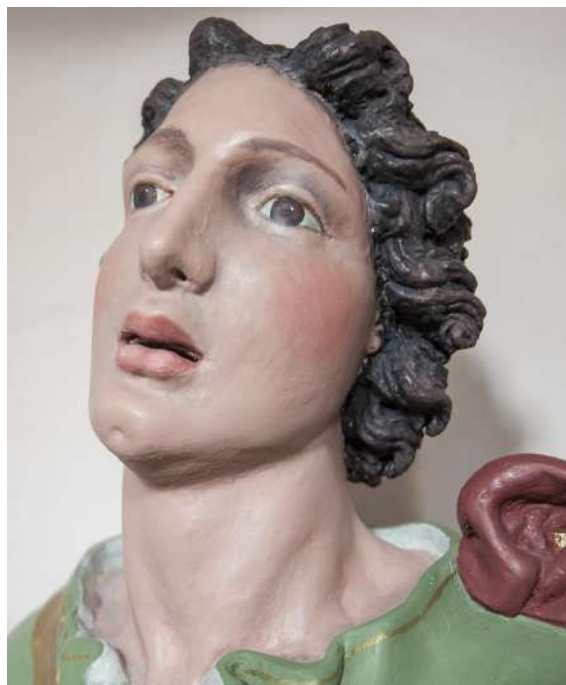
Fig. 32. Saturnino Gatti, San Vito , Colle San Vito di Tornimparte, chiesa di San Vito, particolare