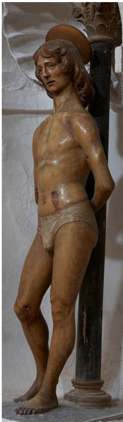
Figg. 2-3. Silvestro dell'Aquila, San Sebastiano , Rocca di Mezzo, chiesa di Santa Maria ad Nives