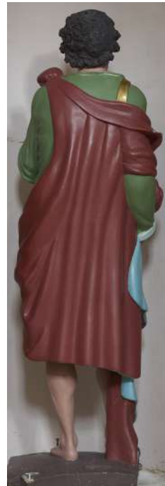
Figg. 19-21. Saturnino Gatti, San Vito , Colle San Vito di Tornimparte, chiesa di San Vito