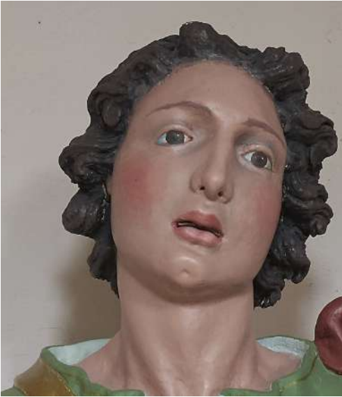
Fig. 29. Saturnino Gatti, San Vito , Colle San Vito di Tornimparte, chiesa di San Vito, particolare