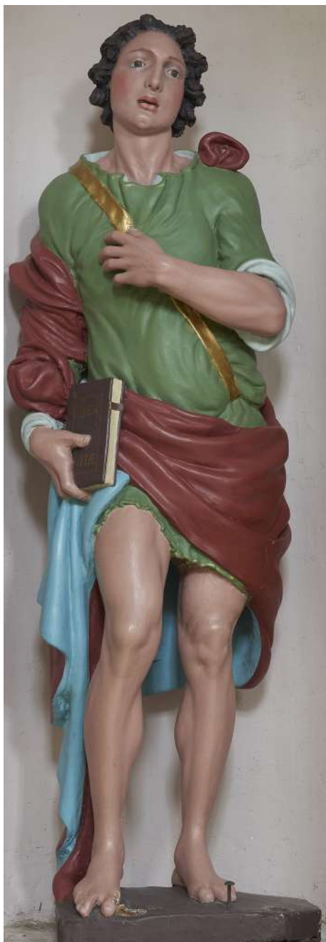
Fig. 27. Saturnino Gatti, San Vito , Colle San Vito di Tornimparte, chiesa di San Vito