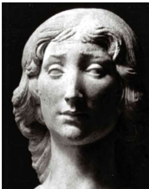
Fig. 12. Silvestro dell'Aquila, San Giovanni evangelista , collezione privata, particolare