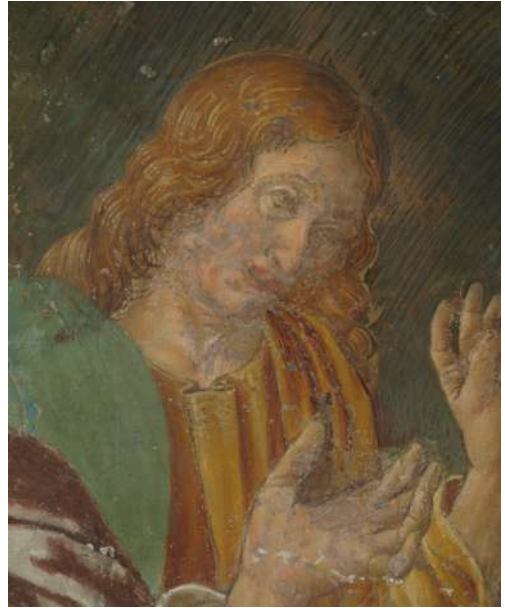
Fig. 24. Saturnino Gatti, Cattura di Cristo , Villagrande di Tornimparte, chiesa di San Panfilo, particolare