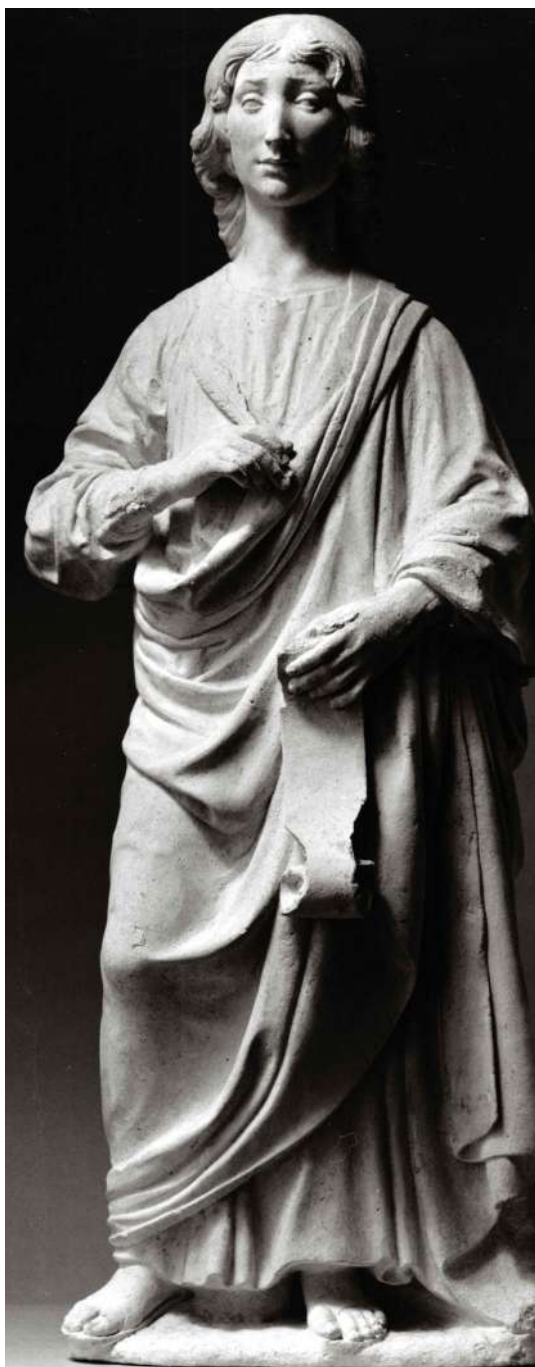
Fig. 7. Silvestro dell'Aquila, San Giovanni evangelista , collezione privata