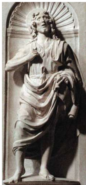
Fig. 6. Silvestro dell'Aquila, San Giovanni Battista , dal Monumento Pereira-Camponeschi, L'Aquila, basilica di San Bernardino