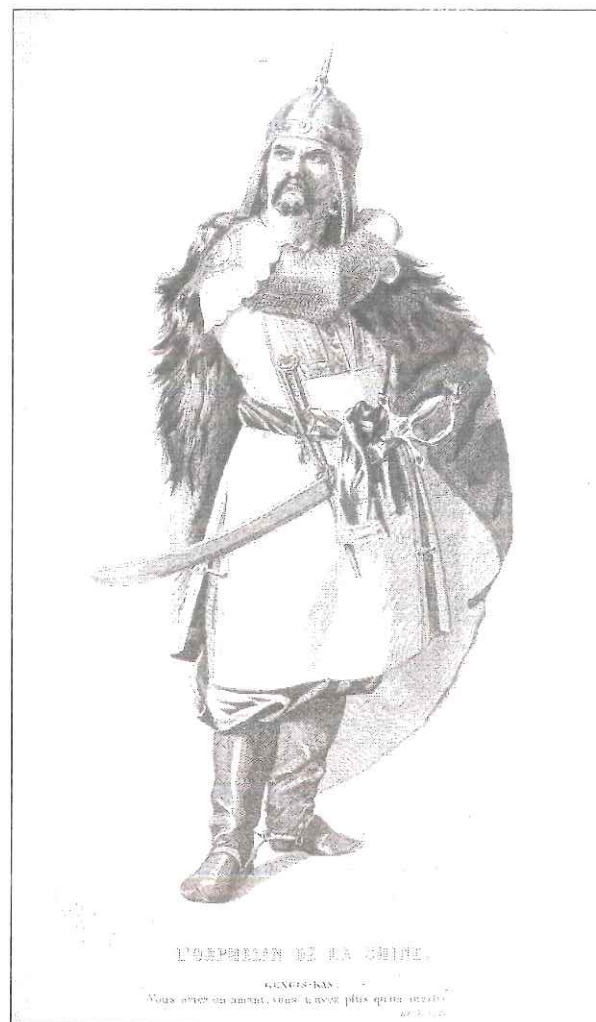
Fig. 3. Gengis Khan in una stampa francese (metà del XIX sec.)