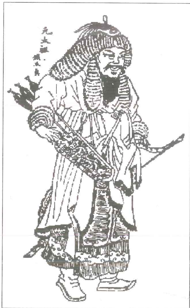
Fig. 2. Gengis Khan