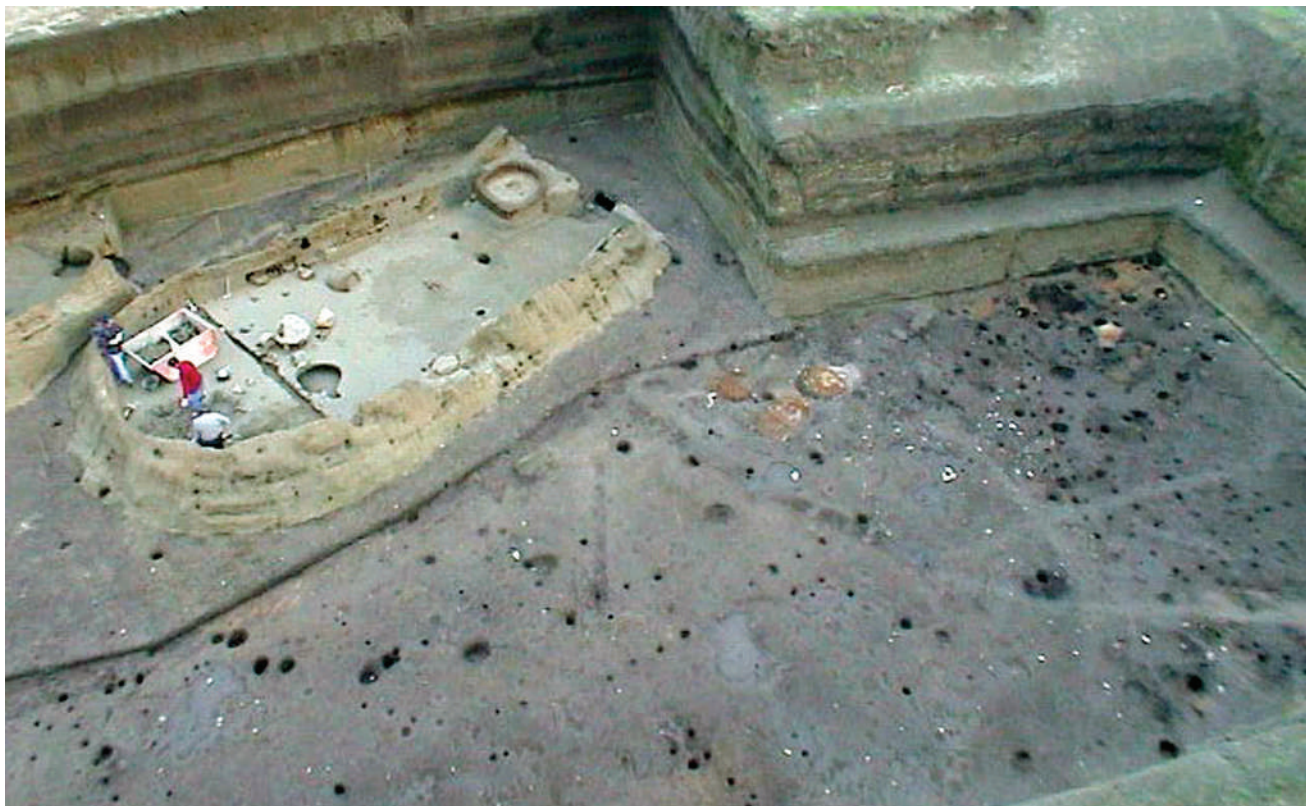
Fig. 51 – Veduta generale dell'area di scavo interessata dalle evidenze dell'area artigianale e del villaggio 2. A sinistra della figura la capanna 3 in corso di scavo.