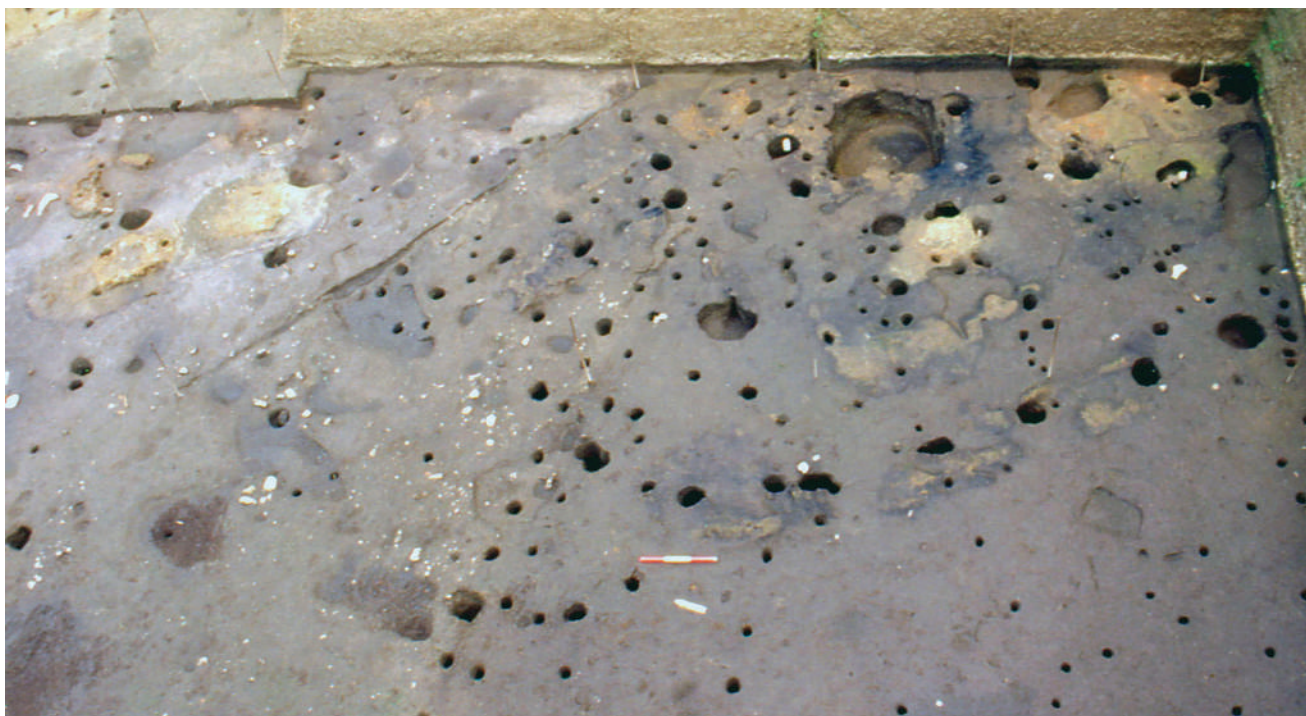
Fig. 52 – Veduta generale della struttura 7 (a sinistra) e della capanna 5 (a destra).