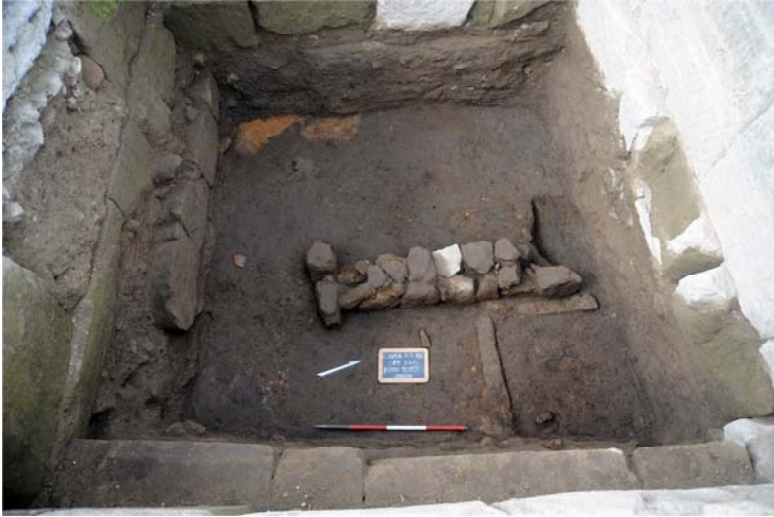
Fig. 3 - Interno di un'abitazione alto-arcaica, da est (saggio in profondità nell'ambiente 32f; foto M. D'Acunto, 2013)