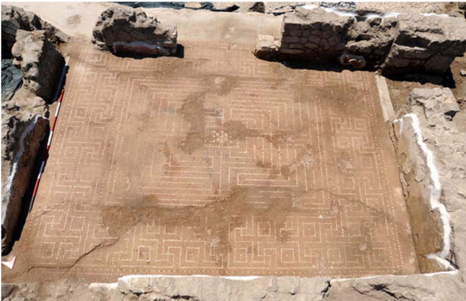
Fig. 6 - Esedra che affaccia sul peristilio della domus meridionale, da nord: pavimento in opus signinum che rappresenta un labirinto (epoca tardo-repubblicana).