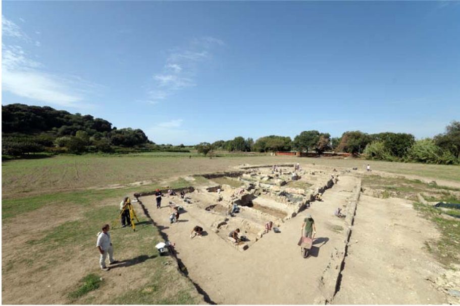
Fig. 1 - Vista generale dello scavo da sud-est, a sinistra l'acropoli e sullo sfondo le mura settentrionali