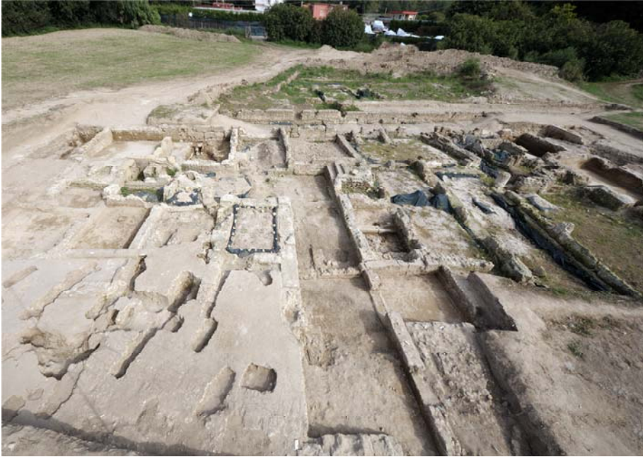
Fig. 7 - Vista generale della domus settentrionale, da ovest: in primo piano il cortile aperto con vasca dell'abitazione imperiale (II-III sec. d.C.)