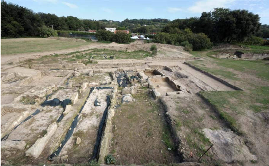
Fig. 5 - Vista generale della domus meridionale, da ovest: in primo piano il peristilio con gli ambienti affacciati su di esso