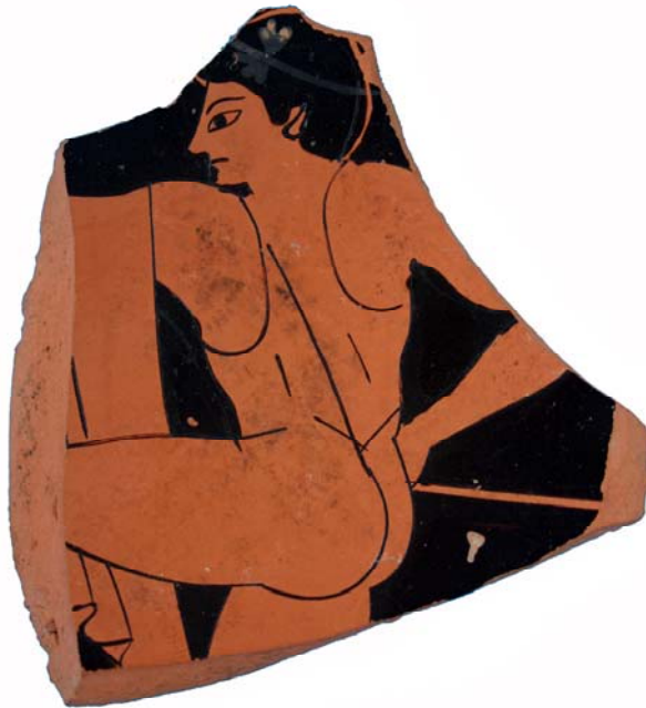
Fig. 4 - Baia, Museo dei Campi Flegrei: kylix attica a figure rosse, Pittore di Euergides, fine del VI secolo a.C.