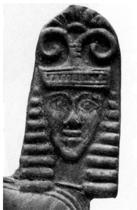
FIG. 3 – DA GORTINA, STIPE DELL'ACROPOLI. PINAX N. 79, PARTICOLARE DELLA SFINGE (DA RIZZA 1968).