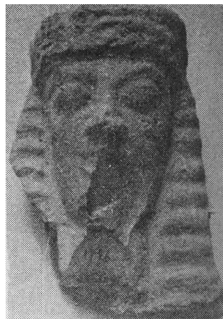
FIG. 5 – DA FESTÒS. TERRACOTTA DEDALICA (DA JENKINS 1936).