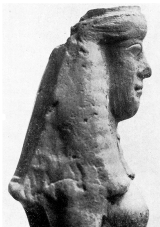
Fig. 4 – DA GORTINA, STIPE DELL'ACROPOLI (DA RIZZA 1968).