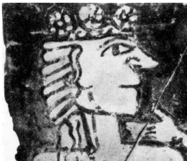
Fig. 7 – DA GORTINA, STIPE DELL'ACROPOLI. PINAX DIPINTO N. 82 (DA RIZZA 1968).