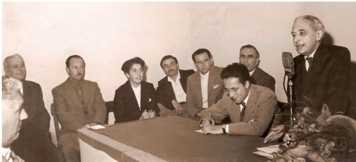
Pettazzoni (a destra) a San Giovanni in Persiceto il 4 ottobre 1953. Parla di disoccupazione, miseria e analfabetismo nell'Italia di allora.

L'8 dicembre 1959 moriva a Roma Raffaele Pettazzoni . Era nato a San Giovanni in Persiceto (Bologna) 76 anni prima. Compiuto il percorso scolastico in paese, si guadagna una borsa per proseguire gli studi a Bologna. All'università si delinea la sua missione: studiare, per la prima volta in Italia, le religioni da un punto di vista storico e comparatistico. La storia delle religioni prende coscienza della pluralità delle religioni e studia le religioni non come verità mutuamente esclusive, ma come molteplicità di espressione di un bisogno dell'uomo che ha generato un'inevitabile pluralità di punti di vista, ciascuno veritiero nei limiti del mondo che si è costruito. Con metodo e determinazione, Pettazzoni tesse una fitta rete di rapporti personali con altri studiosi e personaggi della cultura italiana e mondiale. Il nome di Pettazzoni merita di essere ricordato anche per l' impegno civile in cui concretizzò la ricerca scientifica. Esponente dell'Associazione per la Libertà Religiosa in Italia, Pettazzoni ribadì che la laicità dello Stato sarebbe stata garantita tanto dal pluralismo religioso quanto dall'ateismo. Credente di nessuna religione, chiedeva per ciascun uomo il diritto ad averne una e ad aderirvi con consapevolezza e conoscenza.